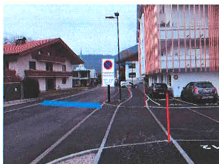
Dr. Franz-Stumpf-Straße, nach der Abzweigung Arzenweg für die Fahrtrichtung Nord

Der in der Verordnung vom 22.04.2011 festgelegte Bereich für die Kennzeichnung einer „Kurzparkzone“ wird in der Dr. Franz-Stumpfstraße geändert. Die neue Kennzeichnung der Kurzparkzone befindet sich – von Norden kommend - nach der Abzweigung des Arzenweges: