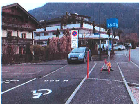
Dr. Franz-Stumpf-Straße, vor dem Gebäude mit der Adresse Arzenweg 20 auf der Gp. 191

Für die beiden neu errichteten Parkplätze vor dem Gebäude Arzenweg 20 mit einer Breite von 6m wird eine Kurzparkregelung verordnet: Max. Parkdauer 90 min., Montag-Freitag von 7.00 Uhr bis 17.00 Uhr, ausgenommen Feiertage.