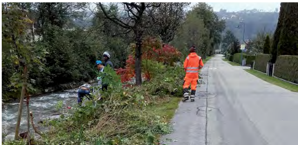
Beim engagierten Einsatz der Bewohner des Asylwerberheimes konnten mehrere Tonnen Springkraut entfernt werden

Die Asylwerber, die sich sehr über die willkommene Beschäftigung freuen, haben in den letzten Wochen außerdem tatkräftig mitgeholfen, dem Springkraut zu Leibe zu rücken. Im gesamten Ortsgebiet wurden mehrere Tonnen (!) des unliebsamen Springkrauts entfernt. Die standortfremde Pflanze mit den rosaroten Blüten breitet sich rasch aus und wuchert vor allem entlang von