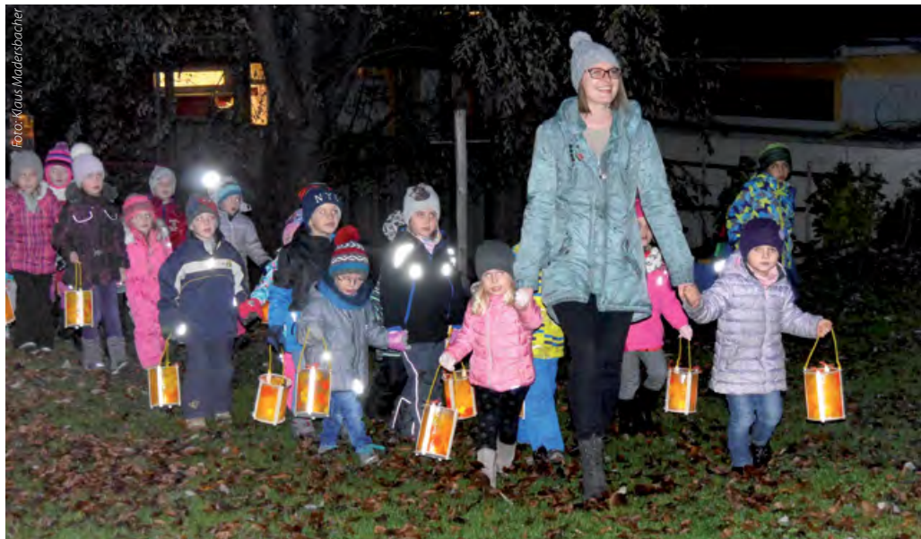
Die Kinder und ihre Begleitpersonen waren eifrig beim Umzug dabei

Knapp 20 Mitarbeiterinnen und rund 200 Kinder machten sich nach Einbruch der Dunkelheit mit schönen Laternen und lautstark singend zum feierlichen Laterndlumzug auf, natürlich begleitet von zahlreichen Eltern. Der kurze Marsch führte vorbei am Sozialzentrum mitanond zum Musikpavillon.