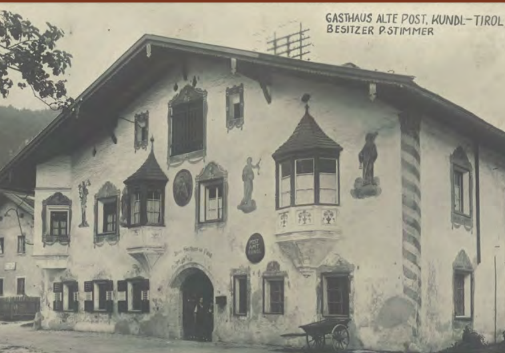
Sogar der Handwagen, mit dem täglich die Post vom Zug abgeholt wurde, steht vor dem Gasthof Post, wo sich im Parterre rechts die Post befand