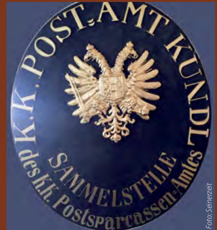
Postamtsschild aus der Kaiserzeit (zu besichtigen jederzeit im Cafe-Restaurant LoCa, Dorfstr. 8 in Kundl)

kanerplatz (Trödlermarkt) dieses alte Postamtsschild zum Verkauf an. Der Kundler Jakob Mayer nutzte diese Gelegenheit, um das Schild zu kaufen und ließ es in der Folge fachgerecht restaurieren.