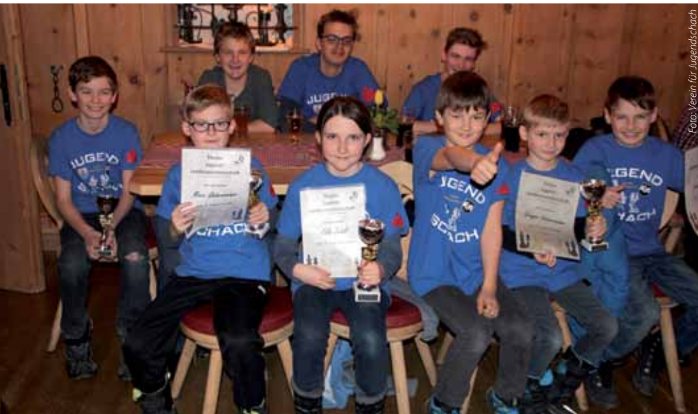
Teilnehmer der Landesmeisterschaft

Unseren Gruß „Schütze Deinen König“ folgend, taktierten unsere Nachwuchstalente sehr besonnen in der diesjährigen Landesmeisterschaft in Hall. Das Zentrum sichernd, brachten sie ihre Figuren in eine strategisch vorteilhafte Stellung, um über den Gegner bei der ersten Schwäche herzufallen. Immer ging ihnen dieses Konzept freilich nicht auf, denn oft hatten sie selber Mühe, die eigenen Linien zu halten und