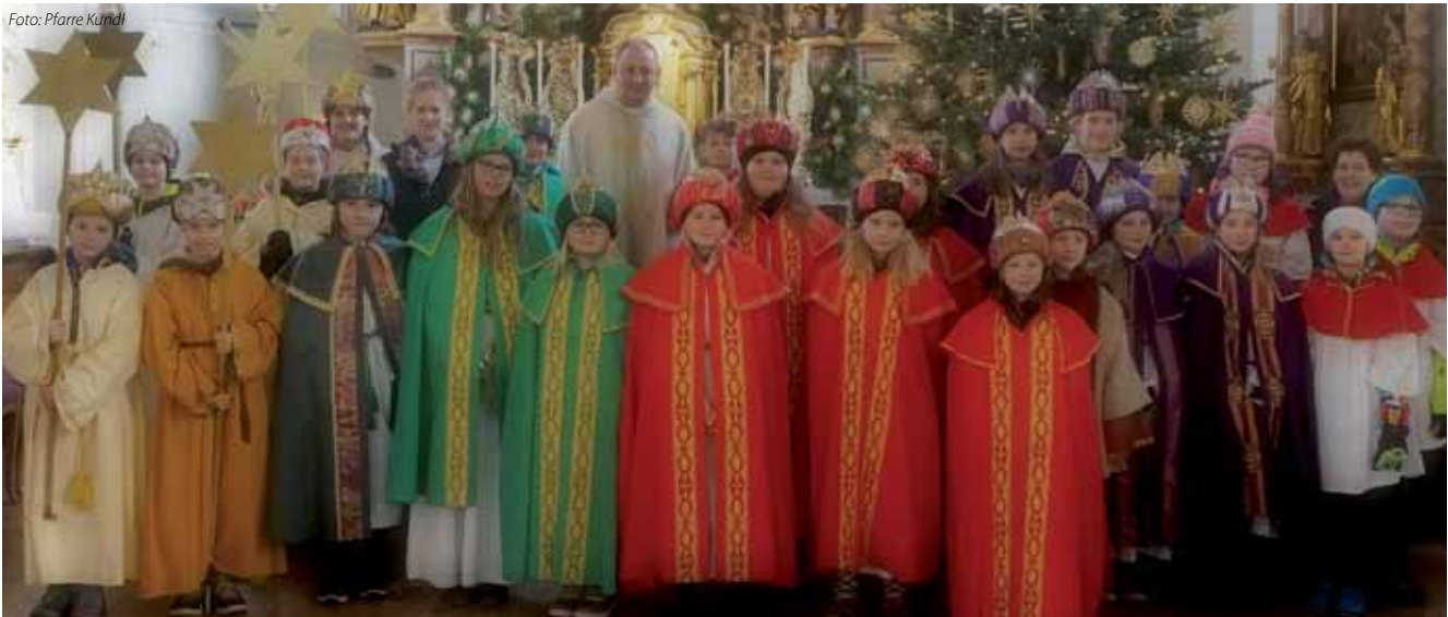
Sternsinger in der Pfarrkirche beim Drei-Königs-Gottesdienst am 06.01.2017

Rund 50 Mädchen und Buben stellten sich auch heuer wieder in den Dienst der Sternsinger-Aktion zugunsten der notleidenden Kinder in Tansania.