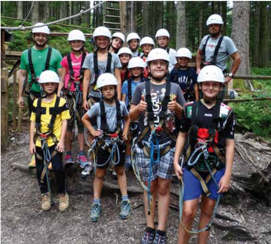
Minicrocodiles im Klettergarten Zauberwinkl

Schon bald können unsere Spieler wieder in der Eisarena der schwarzen Hartplastikscheibe hinterher jagen. Denn mit dem ersten Oktober-wochenende steht unsere Eishalle den EHC'lern wieder zur Verfügung.