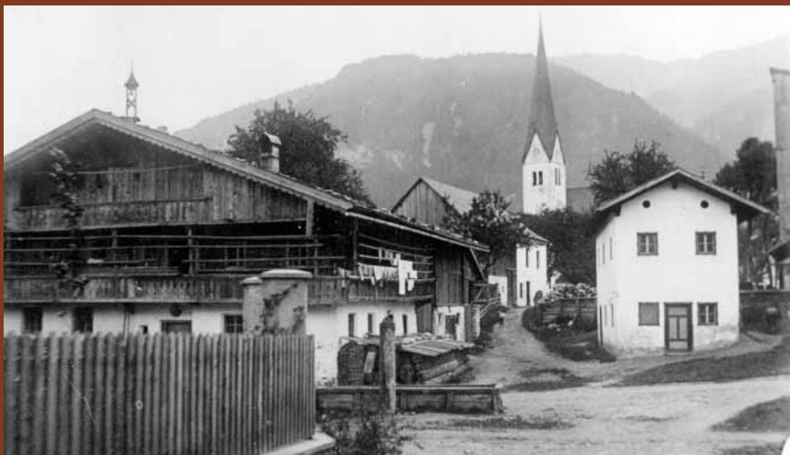
Beim Billinger ca. 1900

her, während im vorderen Teil seine Schwester das Lebensmittelgeschäft weiterführte. 1972 wurde dieses endgültig aufgelassen und die Drogerie auf den gesamten Bereich ausgedehnt. So begann 1915 die 100-jährige Geschichte der Kaufmannsfamilie