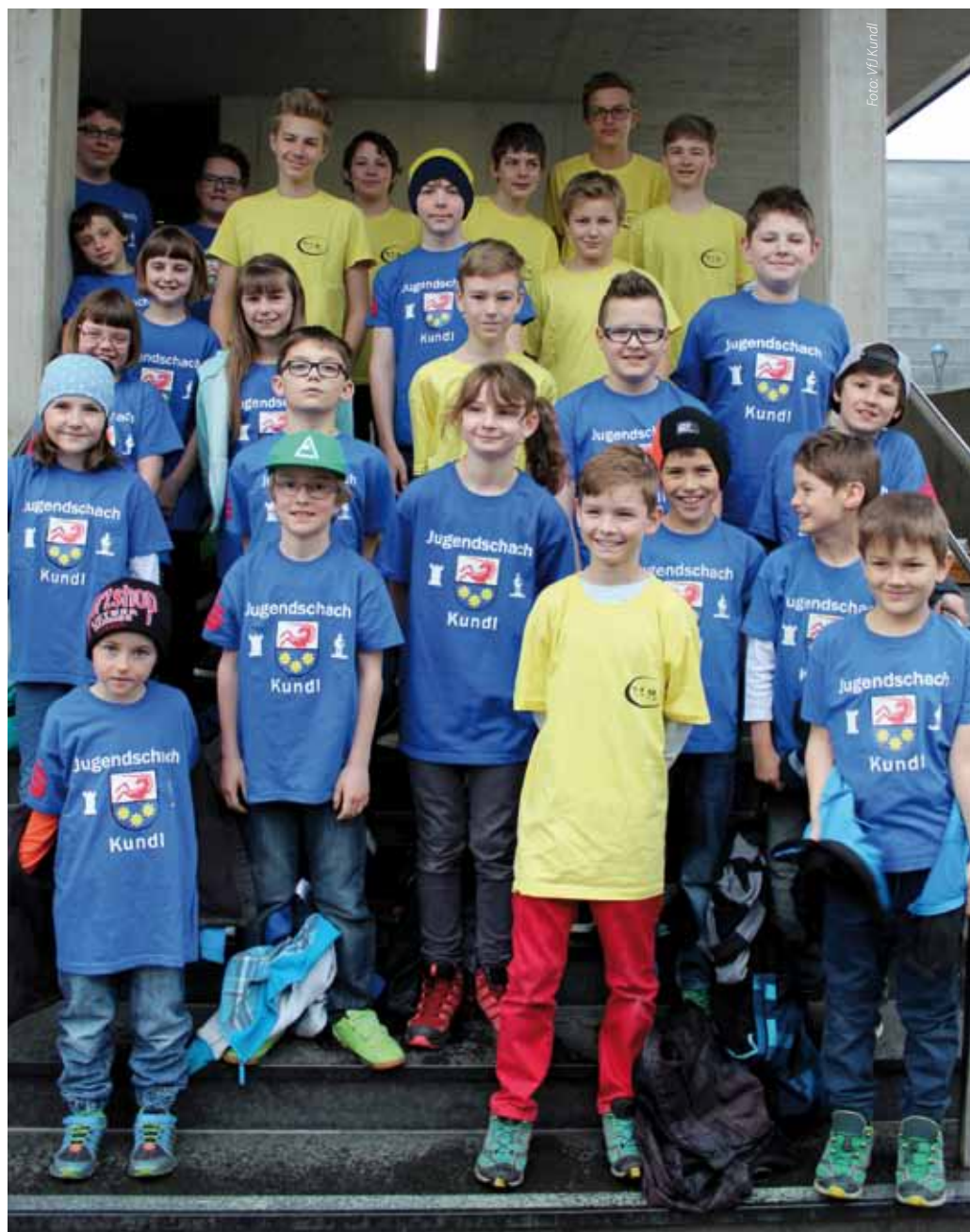
Die Kundler und Breitenbacher Teilnehmer der Landesschul-Schachmeisterschaft

Auch die anderen, mit unseren Nachwuchstalenten bestückten Mannschaften, schlugen sich wacker. Aus sportlicher Sicht beson-