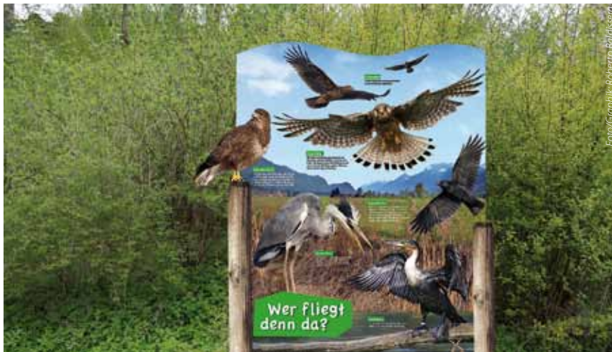
Informationstafel zum Thema Raubvögel

Im Naherholungsgebiet Weinberg entsteht ein Naturlehrpfad mit verschiedenen Themenbereichen. Mit „Naturkundl“ wird dieses Gebiet sowohl naturpädagogisch als auch als Erholungsraum für die ganze Familie erschlossen.