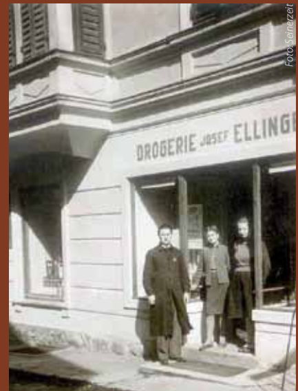
Drogerie Ellinger 1951

Wir könnten viel berichten, das würde aber den Rahmen dieses Berichtes sprengen. So wollen wir die alten Bilder genussvoll betrachten und vor allem der Familie Ellinger danken, dass sie eine Kundler Tradition erhalten hat und ihr für die Zukunft alles erdenklich Gute wünschen.