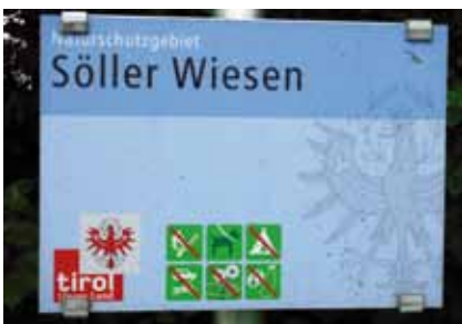
Das Naturschutzgebiet Söller Wiesen besteht aus einer Kern- und Pufferzone

Feuchtgebiete und Moore sowie des Lebensraumes der Pflanzen- und Tierarten, insbesondere der Orchideen-, Amphibien-, Vogel- und Schmetterlingsarten und als Rastplatz für Zugvögel.