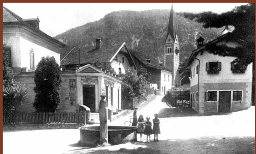
Handlung Ellinger ca. 1920