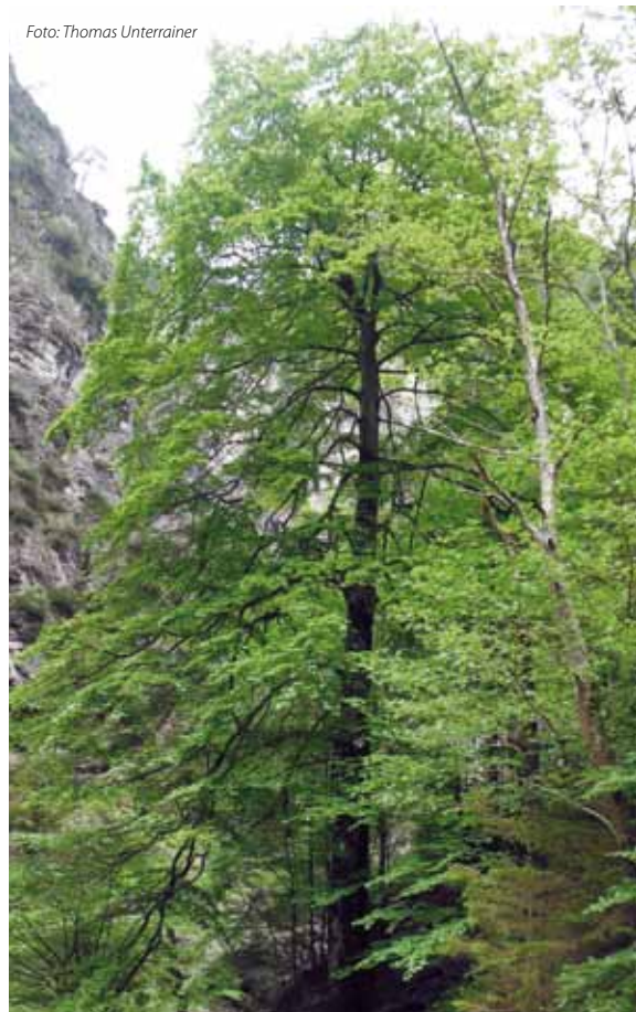
Rotbuche in der Kundler Klamm