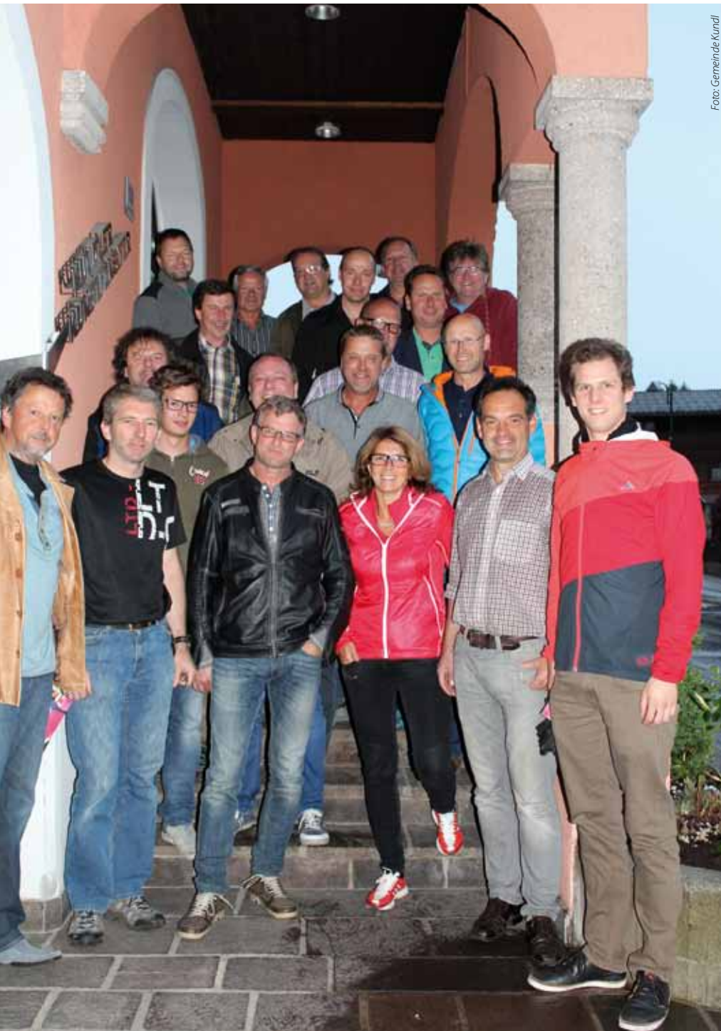
Das Vereinsvertretertreffen war auch heuer wieder gut besucht

Unter diesem Motto lud der Sportausschuss am 20. Mai die Obleute der Kundler Sportvereine zum Vereinsobleutetreffen.