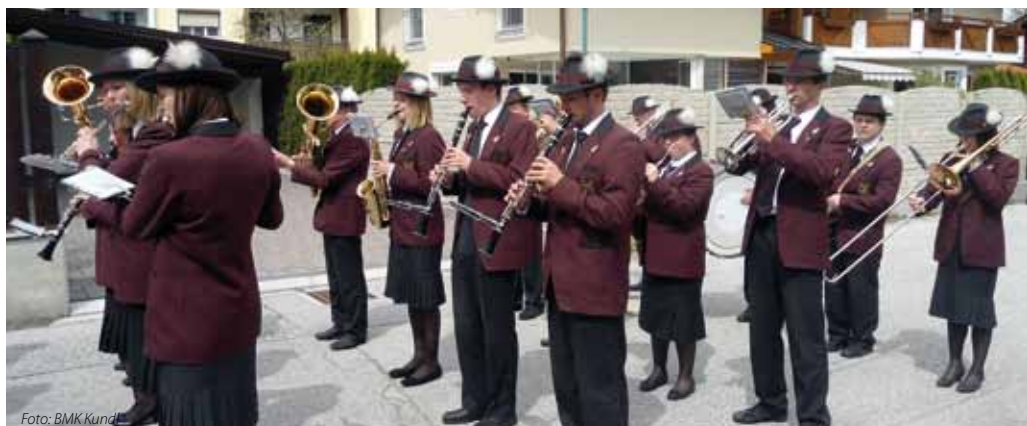
Das Maiblasen in Kundl

Am 15. April 2015 fand unsere Nachwuchswerbung statt. Die Volksschulklassen besuchten uns im Probelokal, um den Verein und die Instrumente kennen zu lernen. Nach der interessanten Vorstellung gab es eine kleine