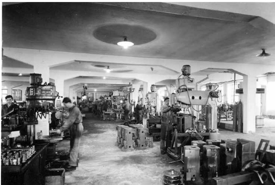
Fa. Lindner, Abteilung Gussformenbearbeitung

Eine weitere Gießerei gab bzw. gibt es immer noch beim Rom, wo zeitweise Bandsägen, Sägemehlöfen und Maschinenteile hergestellt wurden. In den letz-