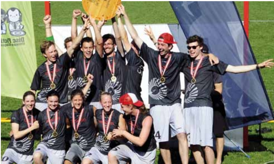
Der Staatsmeister im Mixed Ultimate: die INNsiders aus Kundl

Eigentlich dachten die INNsiders aus Kundl nicht im Traum daran, bei den Mixed Staatsmeisterschaften groß aufzuspielen.