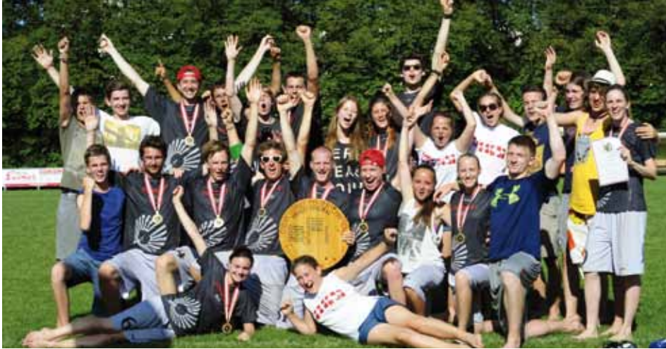
Die INNsiders aus Kundl mit ihrem Nachwuchsteam „INNsiders Next Generation“

Wie ein paar Wochen bereits zuvor ging es für die INNsiders auf nach Italien.