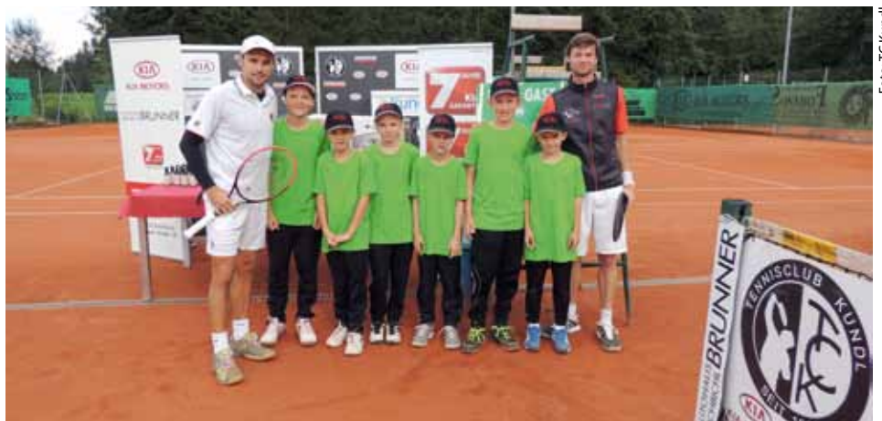
Die Ballkinder mit den beiden Finalisten

Nach monatelanger Vorbereitung war es dann am Freitag, den 22. August endlich soweit. Auch der Wettergott hatte ein Einsehen und die zahlreichen Zuschauer auf der Tribüne und rund um die Tennisanlage des TC Kundl konnten 3 Tage lang tolle, spannende und hochklassige Partien beobachten.