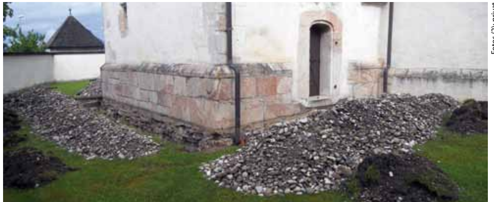
Diese Bild zeigt die Trockenlegung der Sakristeimauern

Ein großer Dank gilt insbesondere der Marktgemeinde Kundl und dem Traktorenwerk Lindner für ihre großzügigen