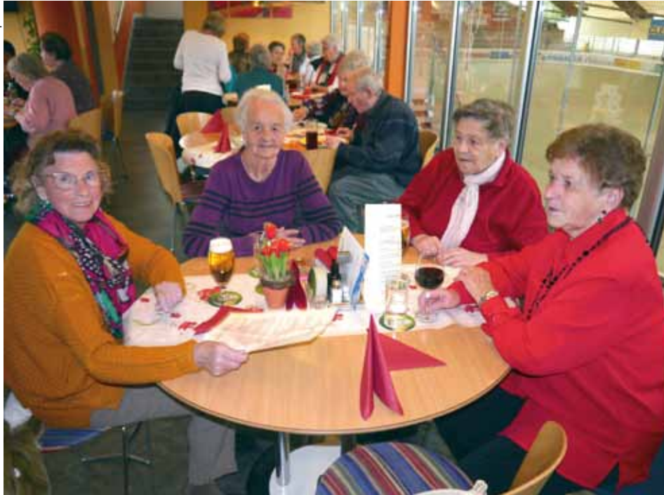
Gute Laune bei der Mutter- und Vatertagsfeier im Millenium

Der Pensionistenverband Kundl lud am Samstag, den 3.5.2014 zur diesjährigen Mutter- und Vatertagsfeier ins „Millenium“ ein.