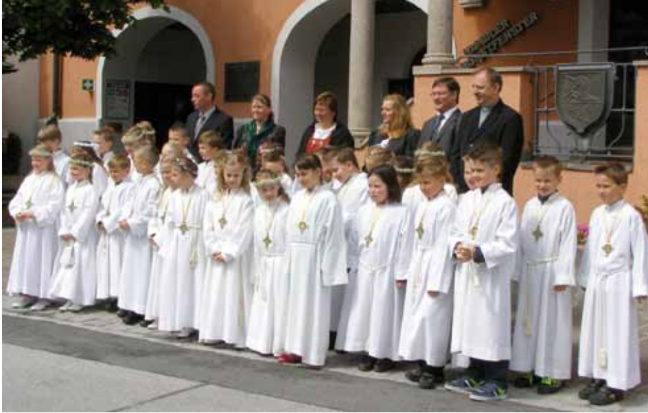
Ein unvergesslicher Tag für die 24 Erstkommunionkinder aus Kundl

Nach gewissenhafter Vorbereitung – Elternabend – Tischmütterrunden – Religionsunterricht – Proben, konnte am Sonntag, den 18. Mai die Erstkommuni-