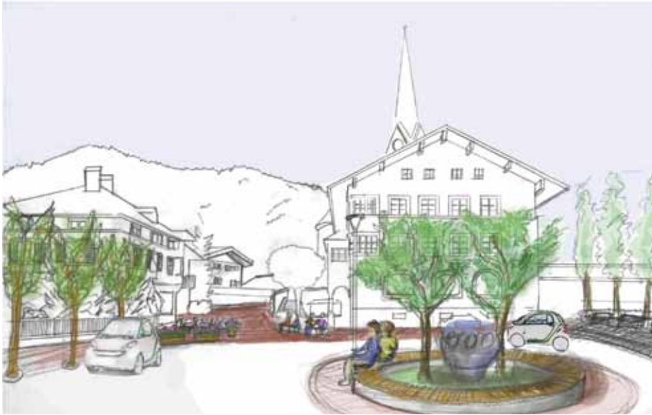
Eine mögliche Variante – „kiss and ride“-Zone zur Entlastung des Ortskerns

Die Ergebnisse der Ideenwerkstatt zur Zukunft des Kundler Ortszentrums und zur Nachnutzung von Gebäuden im Zentrum vom November 2013 waren die Basis für die weitere Arbeit in den Projekt-Stammtischen, die seit Anfang des Jahres stattgefunden haben und äußerst produktiv waren.