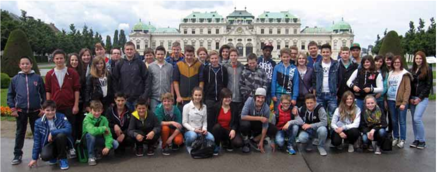
Die beiden vierten Klassen vor Schloss Belvedere in Wien

Heuer durften die beiden 4. Klassen der NMS Kundl im Mai eine spannende Woche in Wien verbringen.