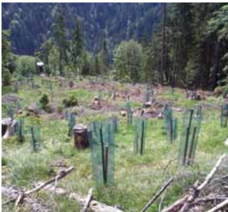
Die professionell eingezäunten Jungtannen

Im Gebiet des Jochbodens – oberhalb des Distelbergs – sowie am Bracherjoch haben in den vergangenen Wochen Aufforstungsarbeiten stattgefunden.