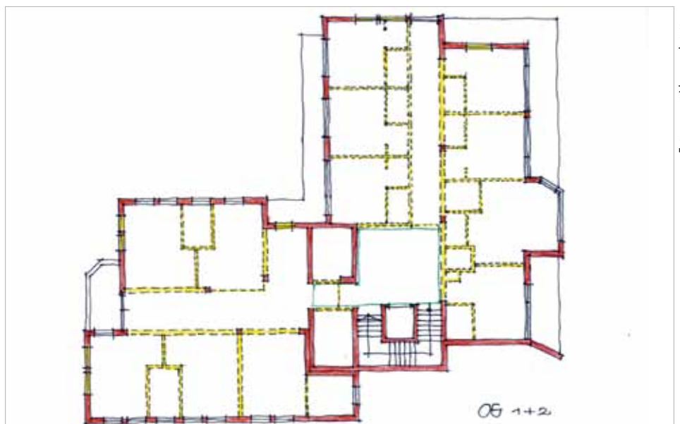
„Buntes Haus“, Grundriss des 1.+2. Obergeschosses, gelb eingezeichnete Wände könnten abgerissen werden

Generell wird ein vielfältiger Mix aus Wohnen und gewerblicher Nutzung (Geschäfte, Büros etc.) mit Gemeinschaftsflächen für Jung und Alt im „Bunten Haus“ gewünscht. In der Abschlussdiskussion wurde gemeinnütziges Wohnen mit nutzungsöffener Erdgeschoßbespielung