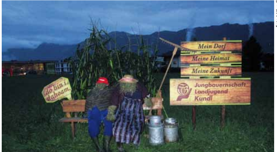
Ausgestellt wurde neben der Bundesstraße

Wir fertigten eine Holzbank aus alten Brettern und gestalteten zwei Leute aus Heu. Wir möchten damit zeigen, dass es auf dem Land viel schöner ist als in der Stadt. Wir können stolz sein, in einer so schönen Umgebung zu leben.