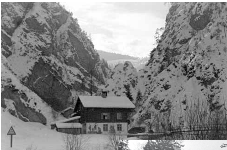
Das alte Klammgasthaus „Zollhäusl“

Unser Streben und all unsere Bemühungen müssen der Erhaltung des Friedens, sowohl überregional als auch in der kleineren Gemeinschaft der Gemeinde und besonders in der kleinsten Gemeinschaft, der Familie dienen.