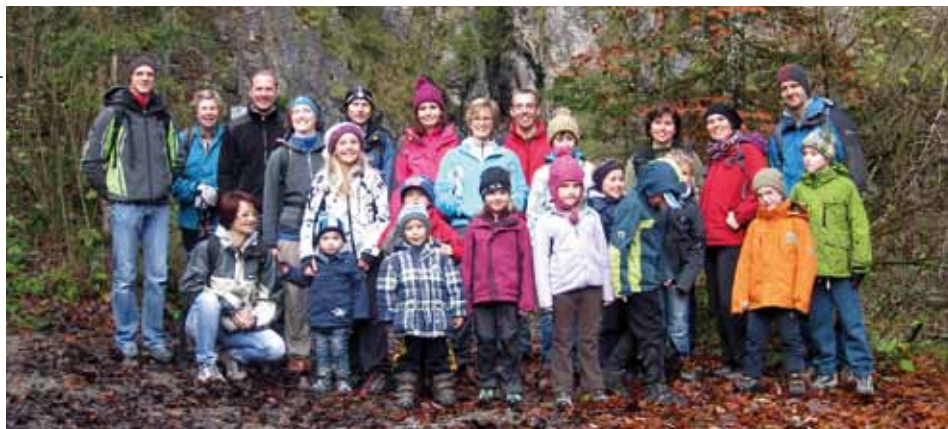
Eingang Gießenbachklamm November 2012

Es ist wieder an der Zeit um einen Rückblick auf vergangene Aktivitäten aus dem Jahr und einen Ausblick auf zukünftige Aktivitäten im Jahr 2013 zu werfen. Der österreichische Alpenverein Ortsgruppe Kundl/Breitenbach hat dafür wieder ein umfangreiches Programm zusammengestellt.