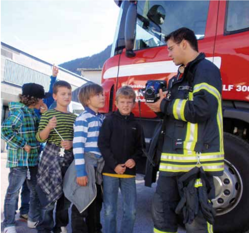
Die Einsatzfahrzeuge sind für alle Kinder ein „Publikumsmagnet“

Sicherheit wird an der Volksschule Kundl groß geschrieben!