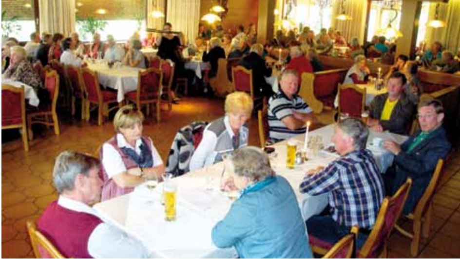
Einkauf im Schlemmergasthof „Bucherwirt“