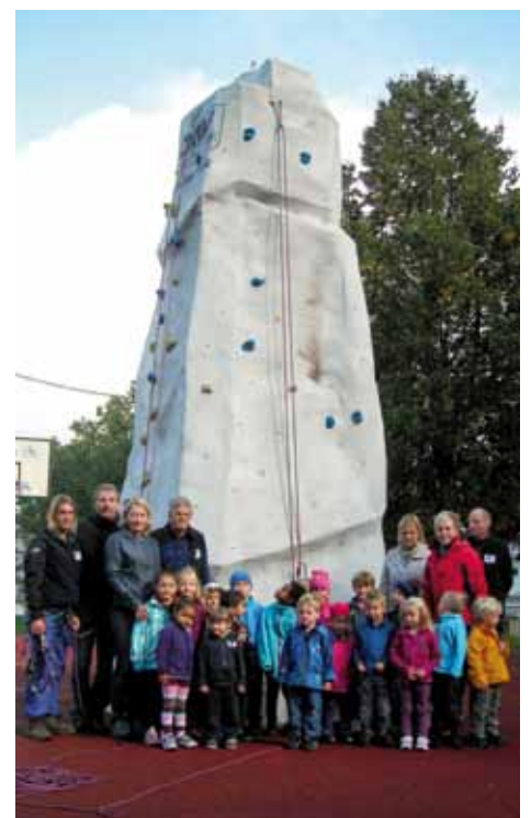
Der Kletterturm begeisterte alle Kinder