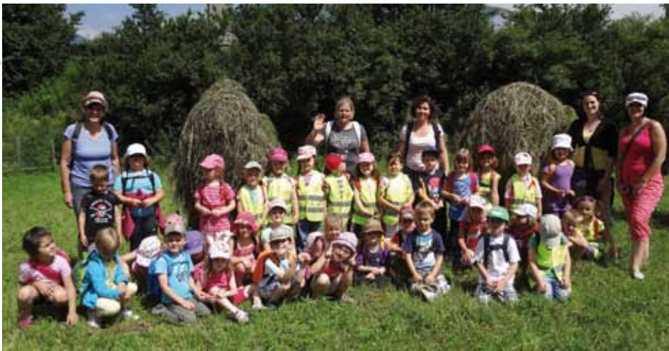
Die Gruppe bei der „Kinderfarm“ in Rattenberg