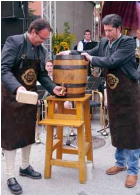
Bieranstich in Kundl

Am Samstag den 1. September feierten die Kundler bereits zum 2. Mal trachtig.