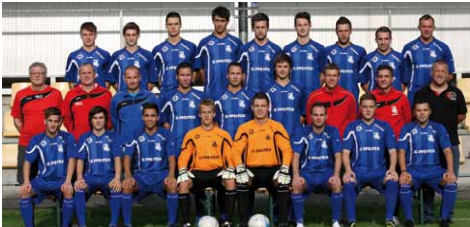
Die Kampfmannschaft I des SC Kundl

Nach der durchwachsenen letzten Saison wurden im Kader und Umfeld der Kampfmannschaft I einige Veränderungen vorgenommen.