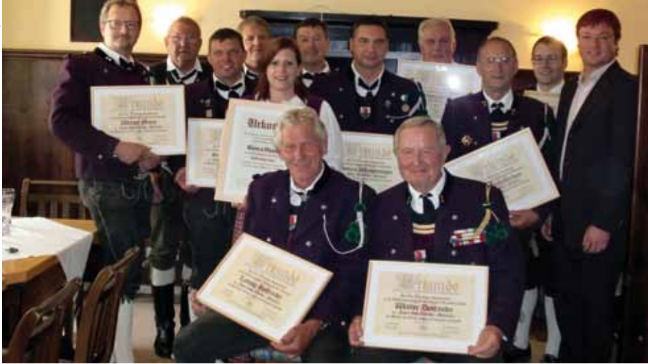
Die geehrten mit den Urkunden und Medaillen

Wie jedes Jahr feierte die Schützenkompanie Kundl am Herz-Jesu Sonntag ihre Jahreshauptversammlung.