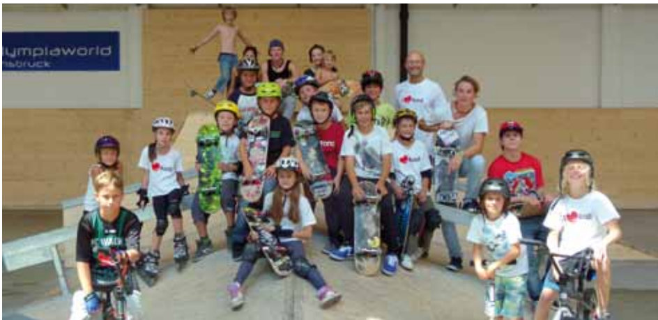
Die Teilnehmer der Spielwoche in der WUB Halle

Insgesamt nahmen 136 Kinder im Alter von 7-14 Jahren teil. Am ersten Tag fuhr eine Gruppe zum Reiten nach Angerberg, eine weitere Gruppe besuchte den Tennisverein in Kundl und einige fuhren zum Brechhornhaus nach Westendorf, wo wir das neue GEO Caching ausprobieren.