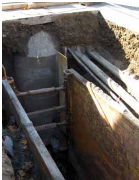
Baugrube mit Schacht