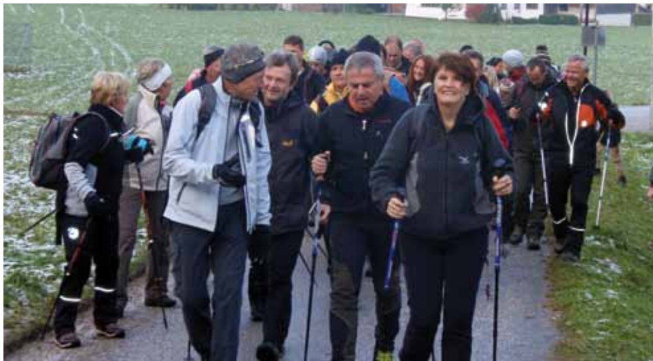
Auf die Plätze - fertig - Los

Unter der Devise „Fit am Nationalfeiertag“ findet auch heuer wieder der traditionelle Fitmarsch in Kundl statt.