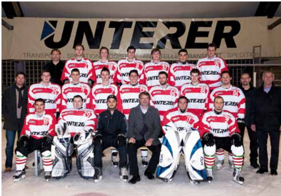
Tiroler Eliteliga Vizemeister 2011/12

Eine mehr als erfolgreiche Eishockeysaison geht zu Ende. Nach unzähligen Punktespielen, Turnieren und Trainings im Zeitraum von Mitte September 2011 bis Mitte März 2012 kann man mit Fug und Recht behaupten, der EHC Kundl ist top.