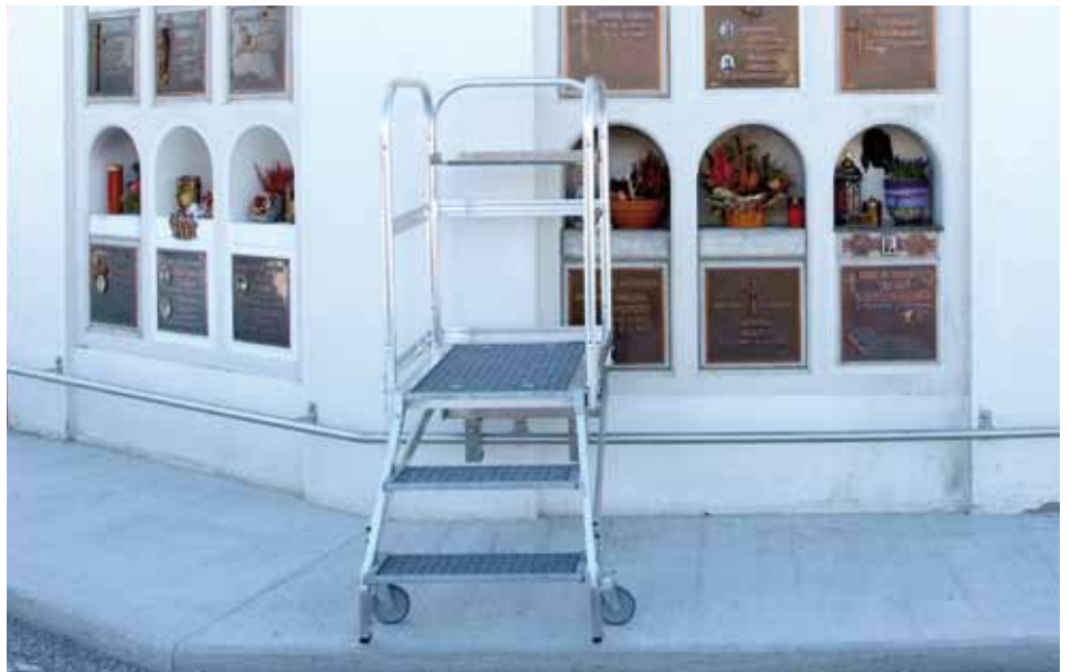
Die bewegliche Treppe für höher gelegene Urnennischen.

Eine weitere Neuerung am Friedhof ist die bewegliche Treppe bei der östlichen Urnenwand hinter dem Kriegerdenkmal. Somit ist sichergestellt, dass man auch die höher gelegenen Urnennischen sicher erreicht.