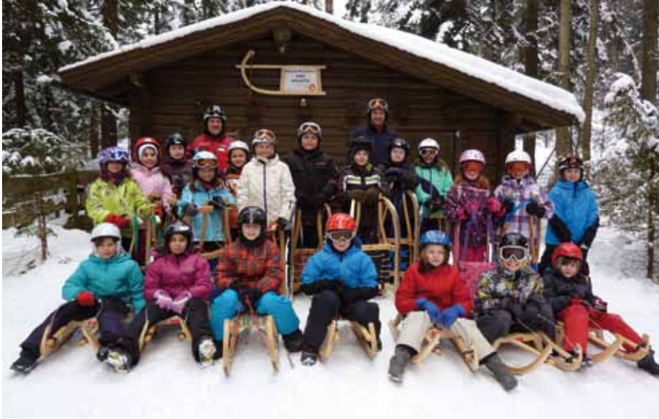
Die Klasse 3a kurz vor dem Start

Einen sportlichen Nachmittag erlebten die Kinder der Klasse 3a beim Rodeltraining in Kundl.