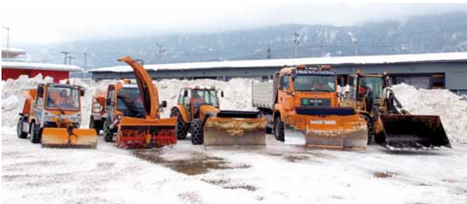
Der Fuhrpark der Gemeinde Kundl

Der Schneefall in den Wintermonaten Dezember und Jänner war enorm. Der Lawnenwarndienst Tirol berichtete, dass an einigen Beobachtungsstationen noch nie so dicke Schneeschichten für diese Jahreszeit gemessen wurden - und die Messungen gehen zurück bis ins Jahr 1960!