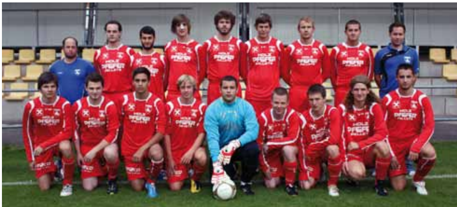
KM II und das Trainerteam

Durchwegs gut präsentierten sich die Mannschaften des SC Kundl bzw. der SPG Kundl/Breitenbach in der abgelaufenen Hallensaison.