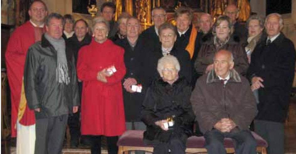
Die Jubelpaare bei der Heiligen Messe

Am 3. Dezember 2011 fanden sich zehn Jubelpaare in der Pfarrkirche Kundl ein.