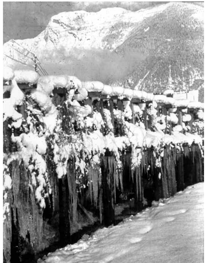
Das vereiste Gerinne des Mühlbaches im Bereich der heutigen Metzgerei Wopfner