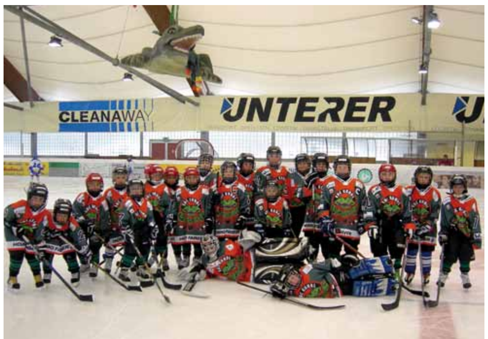
Die junge Nachwuchsmannschaft U8