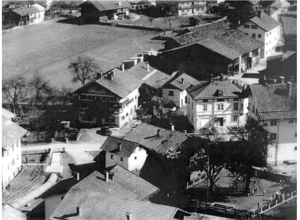
Mühlbach (teilweise verrohrt) zwischen Wagnerei Kruckenhäuser und Aschermühle

So wichtig der Mühlbach auch war, er verursachte doch erhebliche Instandhaltungs- und Wartungskosten, besonders in den Wintermonaten. Weiters