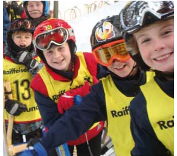
Der RV-Nachwuchs am Start

insgesamt 33 Mannschaften und somit 132 Rodler am Start. Der Rennverlauf ließ auch hier nichts zu wünschen übrig und war spannend wie eh und je. Die Ergebnisse der einzelnen Bewerbe sowie eine Vielzahl an Fotos finden Sie wie immer auf unserer Homepage www.rv-kundl.at