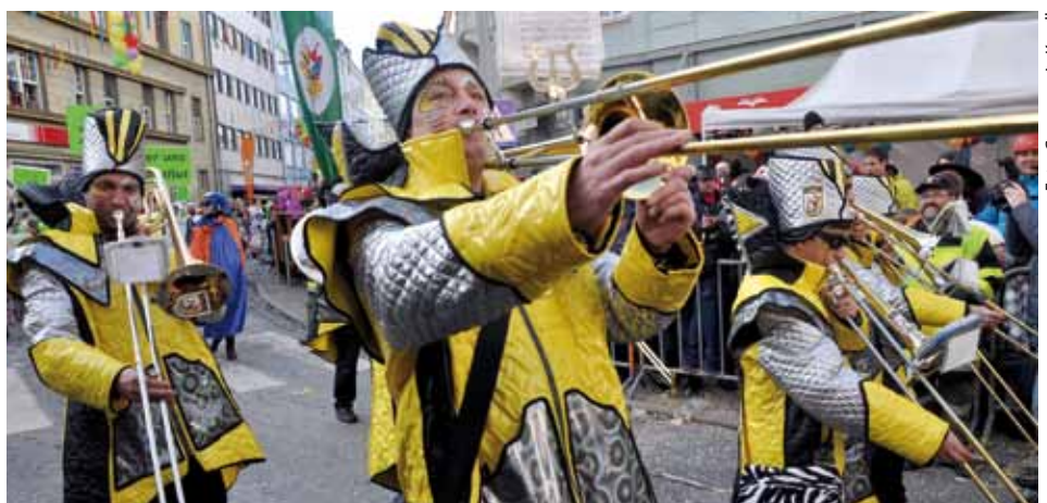
Die Guggamusik beim Umzug in Villach

Der „Tourplan“ der Kundler Guggamusig kann sich sehen lassen: So spielte der Verein unter anderem in Hochfilzen bei den Langlaufbewerben, beim Fritzenener und Innsbrucker Faschingsumzug, sowie beim bekannten