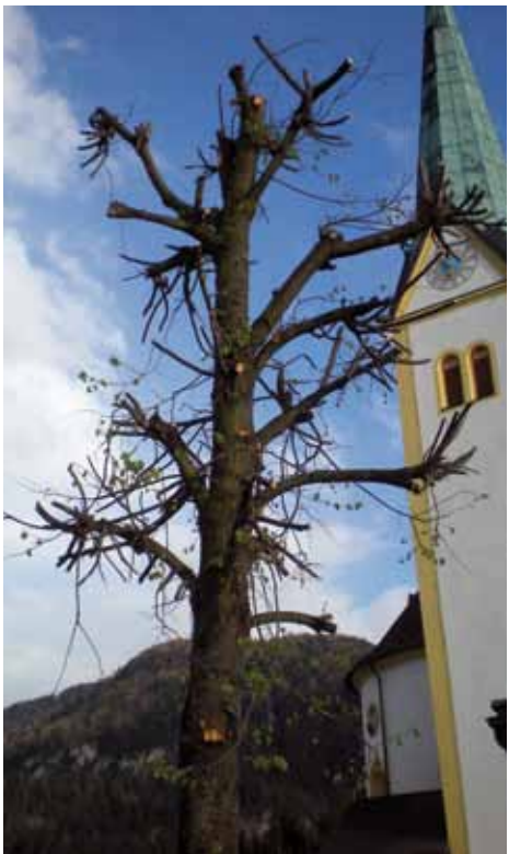
Nicht fachgerechter Baumschnitt

In den vergangenen Jahren sind die Baumschnittarbeiten im Dorf oft nicht fachgerecht durchgeführt worden. Aus diesem Grund werden zukünftig diese Tätigkeiten nur noch von ausgebildeten Baumschneidern erledigt.