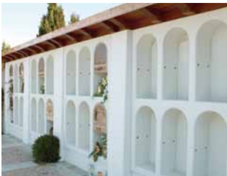
Die Erweiterung der Urnenwand

Eine weitere Neuerung am Friedhof ist die bewegliche Treppe bei der östlichen Urnenwand hinter dem Kriegerdenkmal. Somit ist sichergestellt, dass man auch die höher gelegenen Urnennischen sicher erreicht.