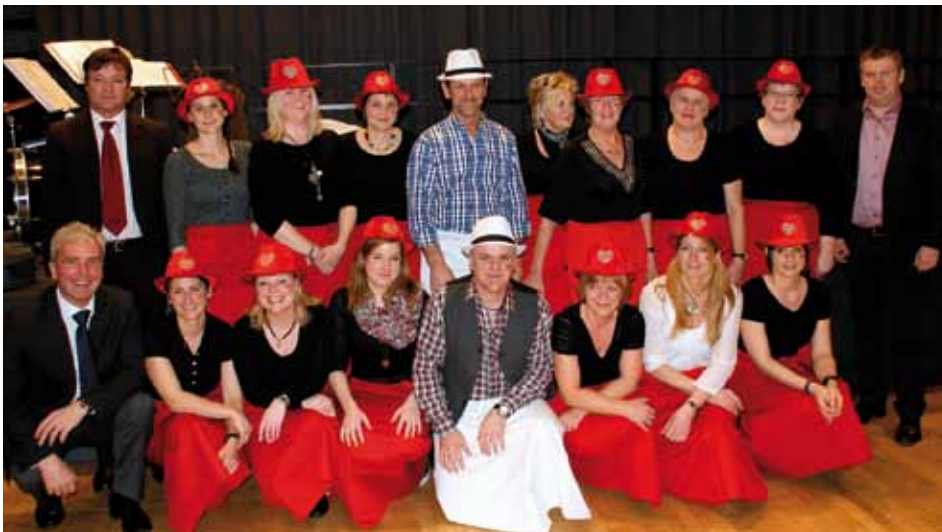
Das flotte Serviceteam mit den Gemeindevertretern

Am 12. Februar 2012 fand im Gemeindesaal die Faschingsfeier für unsere SeniorInnen statt.