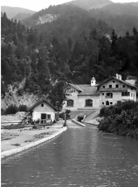
E-Werk mit großer „Masserei“

1891 beantragte die Brauerei den Bau eines E-Werkes mit den dazugehörigen Gerinnen, eines Dynamohäuschens, sowie einer Freileitung. Noch heute erinnert das Turbinenhaus an dieses erste E-Werk.