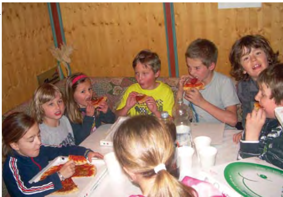
Unsere jungen Schirennläufer beim Pizzaessen

Mit dem traditionellen und beliebten Pizzaessen in unserem WSV Vereinslokal wurde die Wintersaison 2009/2010 für die WSV-Kids beendet.