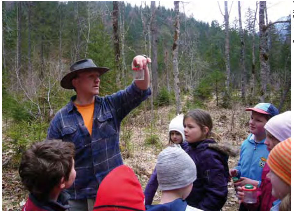
Unterricht im Freien

seres netten Vormittags wurden gefilmt und im KBTv ausgestrahlt!