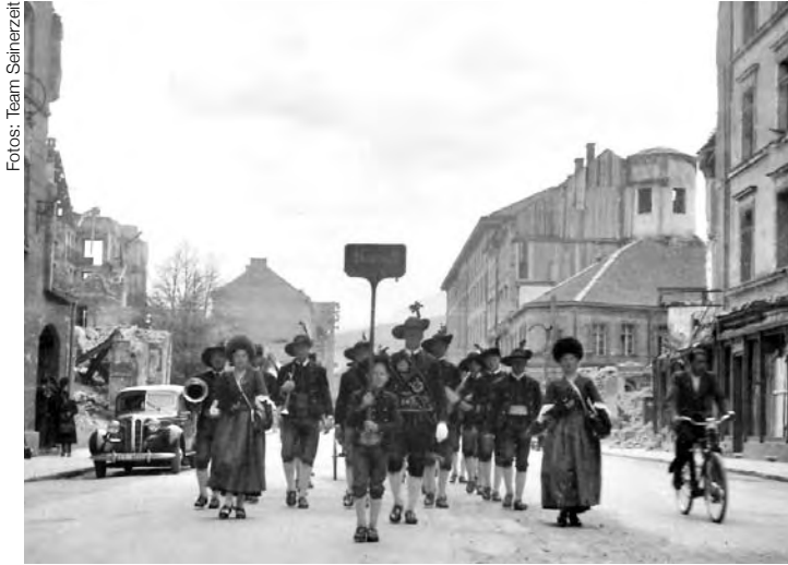
Die Kundler Musikkapelle 1945 in Innsbruck

Diese sensationelle Aufnahme zeigt die Kundler Musikkapelle im Herbst 1945 in Innsbruck und zwar in der Wilhelm-Greil-Straße nahe dem Boznerplatz. Die schweren Bombenschäden sind noch nicht beseitigt, da es an Baumaterial total mangelte. Bisher gelang es nicht, die genaue Zeit und den Grund dieser Ausrückung herauszufinden.