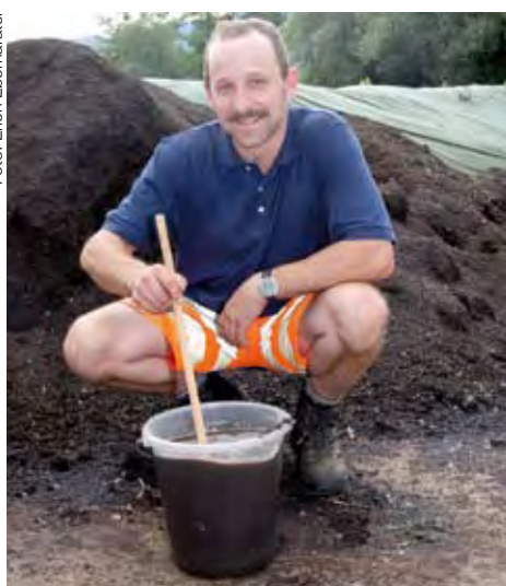
Der „Hexer“ bei der Arbeit