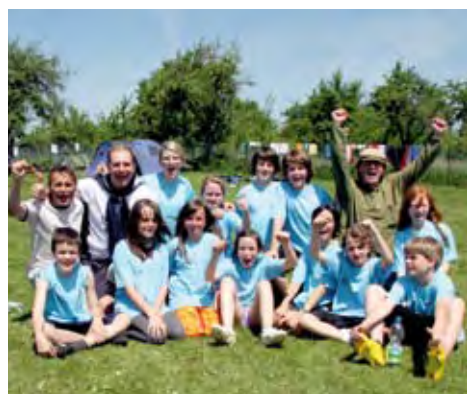
Ultimate Frisbee macht Spaß

Vom 21. bis zum 24. Mai 2010 fand ein weiteres Mal das traditionelle Ultimate Frisbee Pfingstturnier in Bad Rappenau/Deutschland statt. 23 Jugendteams aus drei Nationen trafen sich, um beim dreitägigen Turnier den Sieger in den Altersklassen U14, U17 und U20 zu ermitteln.