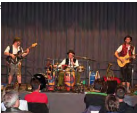
Die bayrische Parodetruppe

Auf Einladung des Kulturausschusses gastierte Bayerns traditionellste „Boygroup“ mit einem deftigen Wirtshausprogramm im Kundler Gemeindesaal.