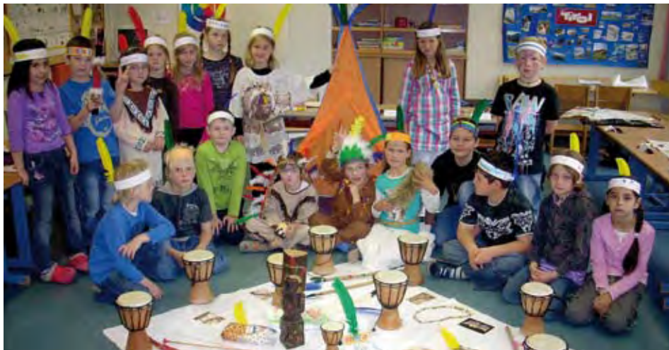
Die „Rothäute“ unter sich

Einen besonderen Schultag erlebten die Kinder der Klasse 1a, als es hieß: Die Indianer sind los!