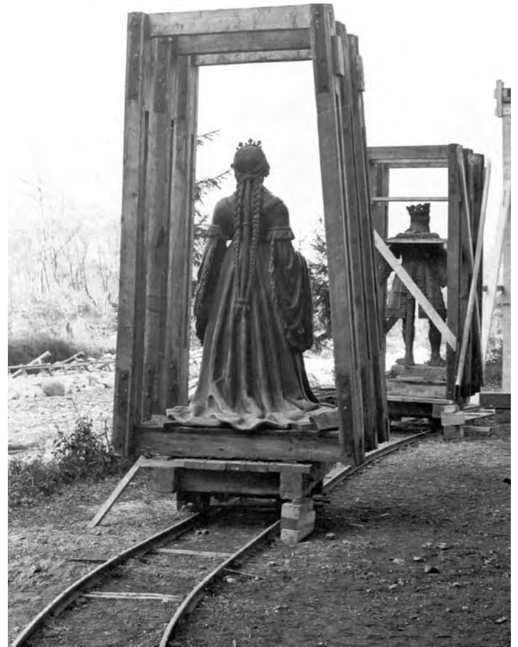
Unversehrt und hoch erhobenen Hauptes kehren die "Schwarzen Mander" mit ihren Frauen nach knapp zwei Jahren zurück in die Hofkirche