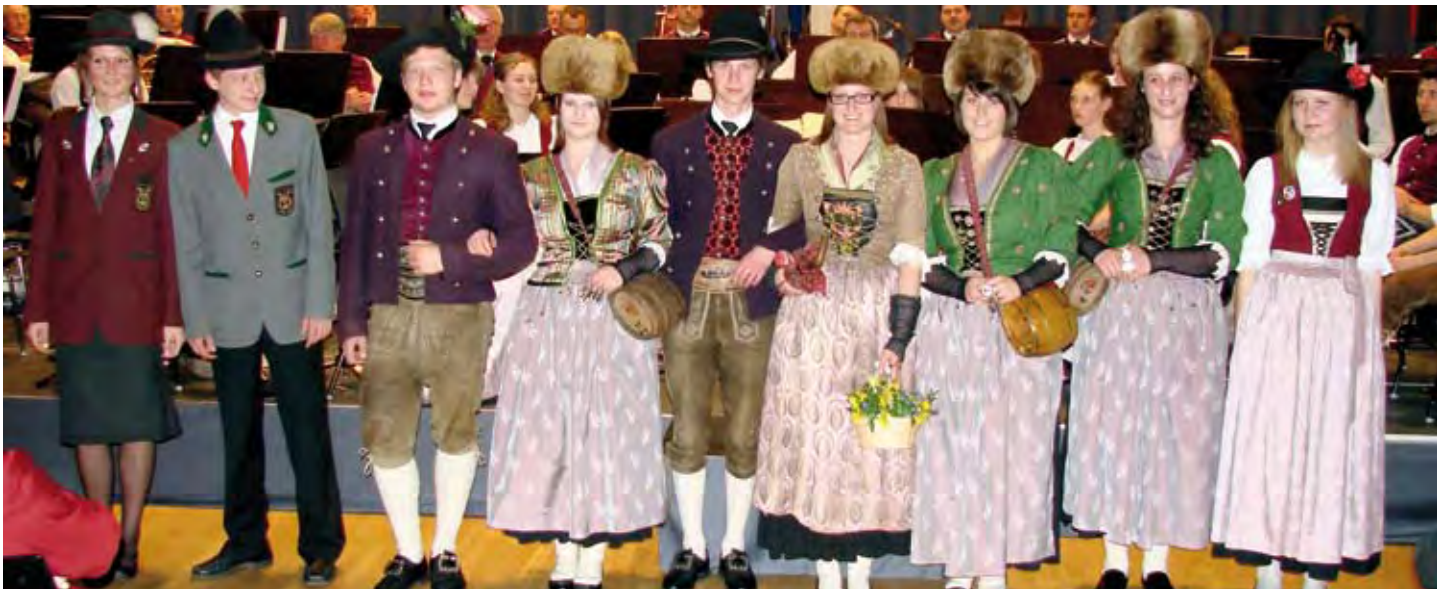
Musikantentrachtenschau im Wandel der Zeit