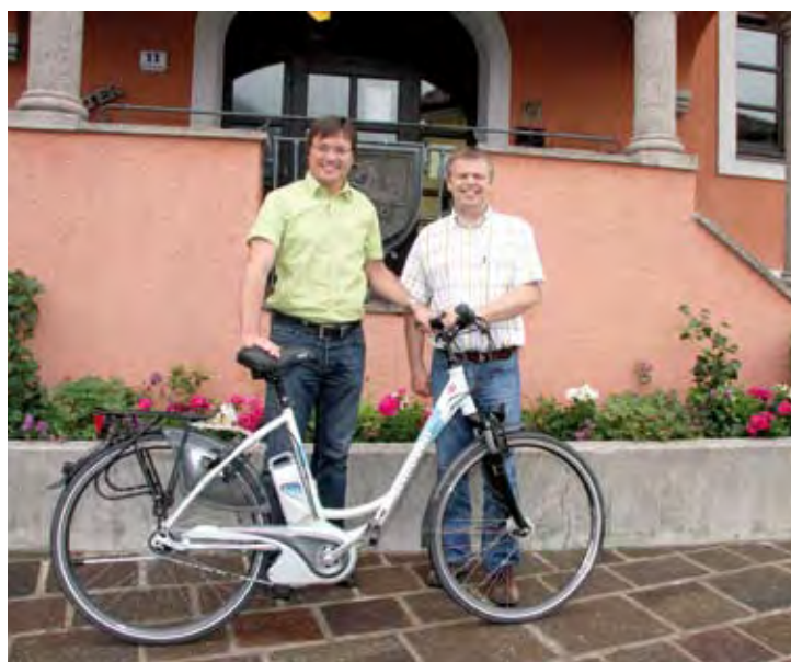
Ein Elektrofahrrad sollte man haben