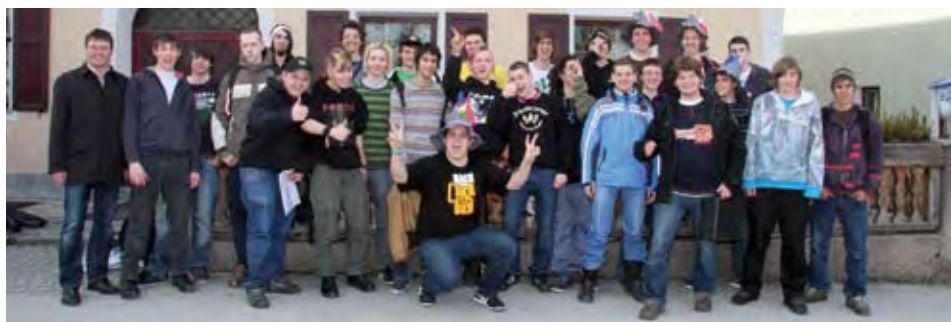
Der Jahrgang 1992 nach der Musterung