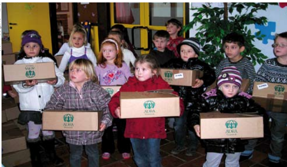
Die Kinder waren mit viel Einsatz dabei

Um den Kindern anschaulich „Teilen und Helfen“ zu vermitteln, beteiligte sich der Kindergarten um