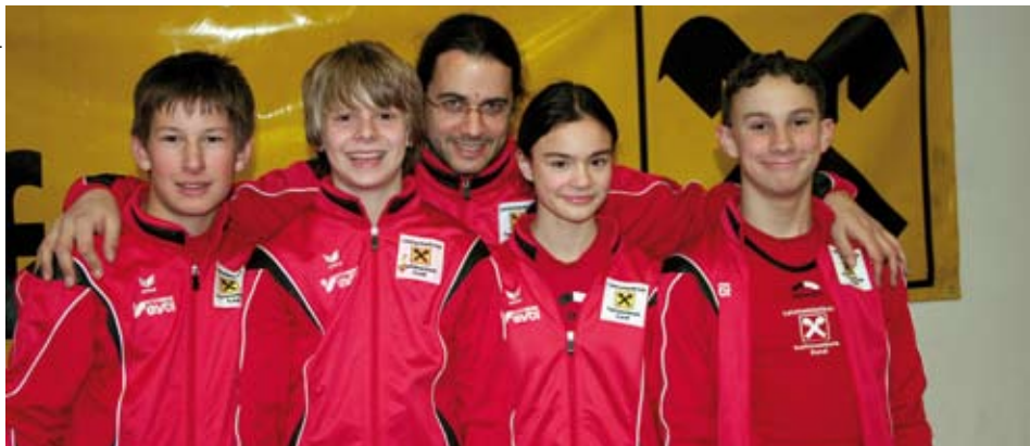
Das erfolgreiche Quardett mit seinem Trainer

Dass die Leichtathletik im Winter nicht ruht, sondern mit Hallen-Wettkämpfen die Leistungen der Athletinnen und Athleten überprüft, belegen die Erfolge unserer Teilnehmer.