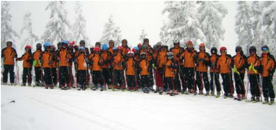
Das Team von WSV im neuen „Outfit“

In die heurige Wintersaison starteten die Kinder und Jugendliche des WSV Kundl mit neuen Schijacken.