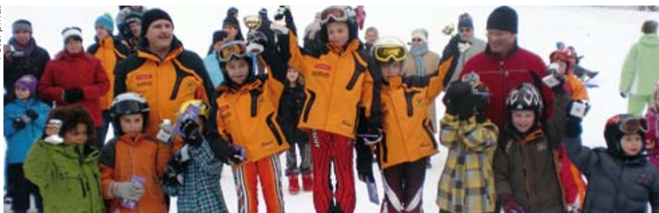
Ein Stockerlplatz ist das schönste Erlebnis

Auch heuer wieder organisierte der WSV-Kundl in bewährter Weise für unsere Jüngsten das sehr beliebte Kundler Zwergerrennen 2010.