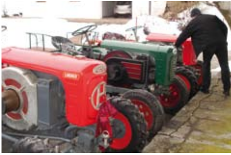
Die Oldtimer stehen für die nächste Ausfahrt bereit

Spätestens jetzt beginnt für jeden Oldtimierliebhaber die Zeit, in der man schmiert, putzt und vielleicht die erste kleine Runde in der Nachbarschaft fährt.