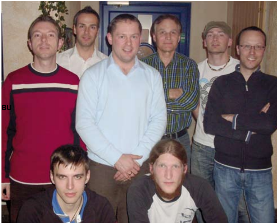
Der Vorstand des TC Kundl

Am 27.02.2010 fand die diesjährige Generalversammlung des Tennisclubs Kundl statt. Der alte Vorstand wurde bestätigt und steht für ein weiteres Jahr in denselben Funktionen zur Verfügung: