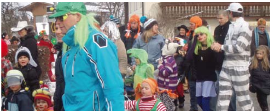
Zahlreiche „Faschingsfans“ beim Umzug durch Kundl

Mit einem kleinen Umzug am „Un-sinnigen Donnerstag“ begann der 1. Kinderfasching der Marktgemeinde.