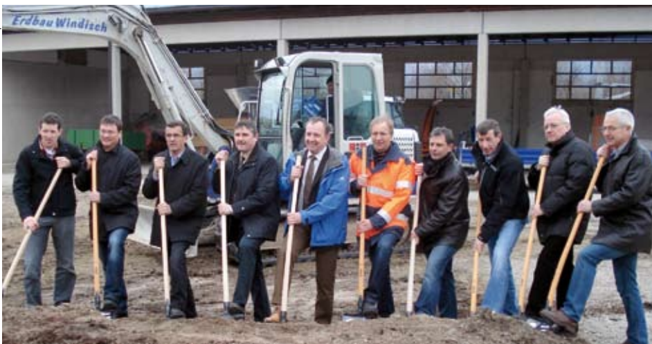
So viele „Schaufler“ sieht man kaum

Am 4. März 2010 erfolgte der Spatenstich zum Neubau des Kundler Bauhofes sowie des Wertstoffsammelzentrums auf dem ehemaligen „Unterrainer-Areal“.