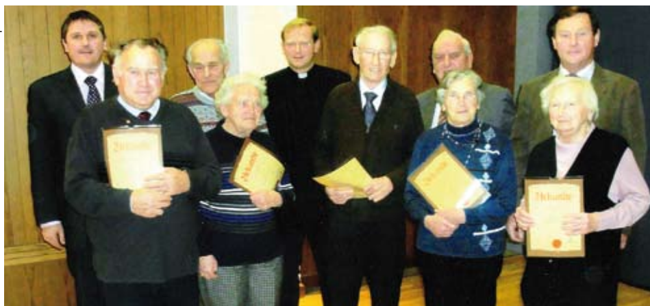
Die Geehrten mit den Ehrengästen

Im Jänner fand die Jahreshauptversammlung 2010 im Kundler Gemeindesaal statt.