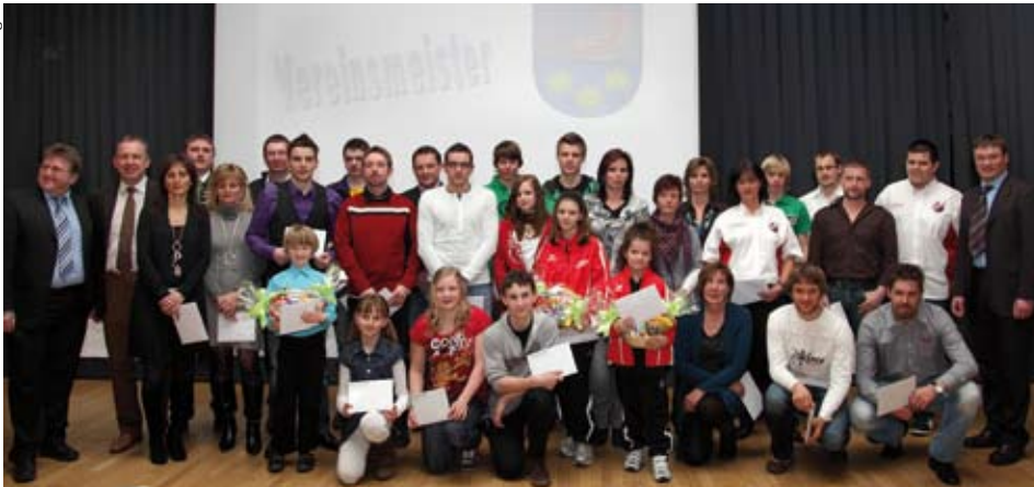
Unsere sportliche Kundler Elite