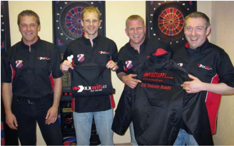
Der DC Unicorn Kundl im neuen Outfit

Das Anwachsen des Clubs veranlasste die Führung des Gasthofs Neuwirt zum Ausbau eines eigenen Trainingsraums, in dem nun ungestört vom Gasthausbetrieb trainiert werden kann. Auch das Jugendtraining lässt sich nun leichter bewerkstelligen.