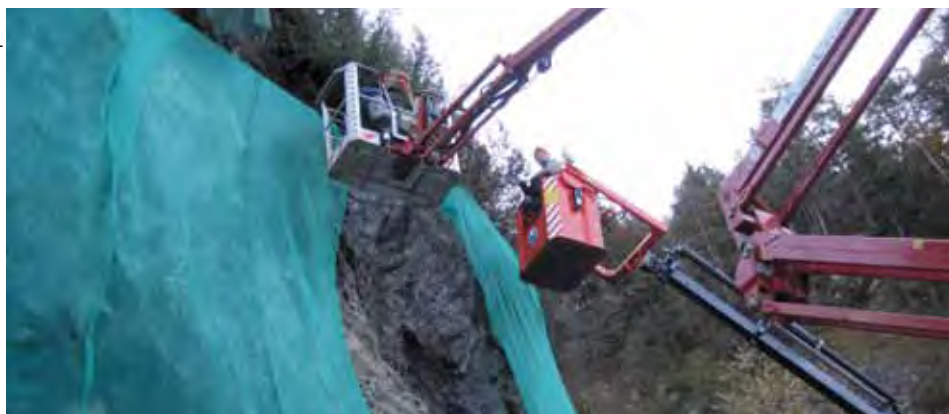
Bei der Netzmontage

Da die Rodelbahn im Bereich der Felsenkurve in den letzten Jahren vermehrt von Steinschlägen betroffen war, hat man sich nach zahlreichen Reparaturen am alten Netz dazu entschlossen, dieses zu erneuern.