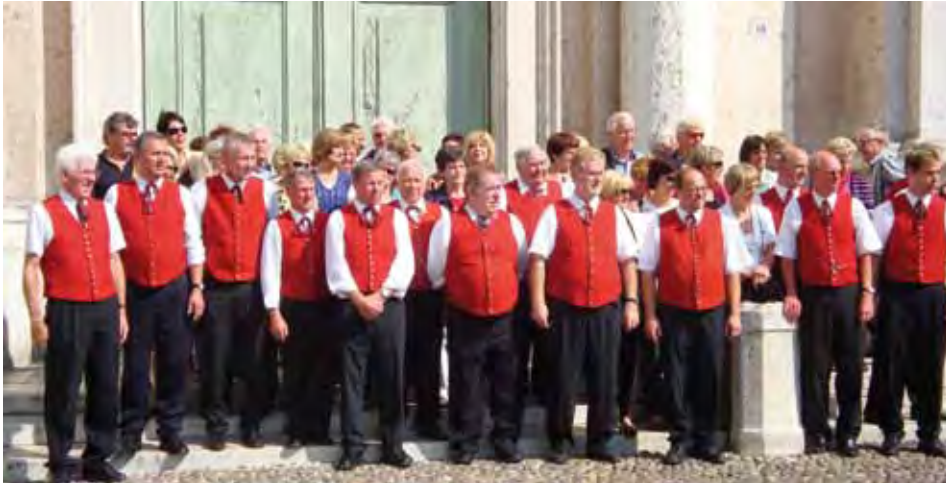
Vor dem Dom zu Mantua

Der Männerchor Kundl hat mit seinen Freunden und Gönnern Ende Oktober seinen beliebten Herbstausflug durchgeführt. Heuer stand wieder nach längerer Zeit ein zweitägiger Ausflug am Programm. Unter dem Motto „Kultur und Geschichte“