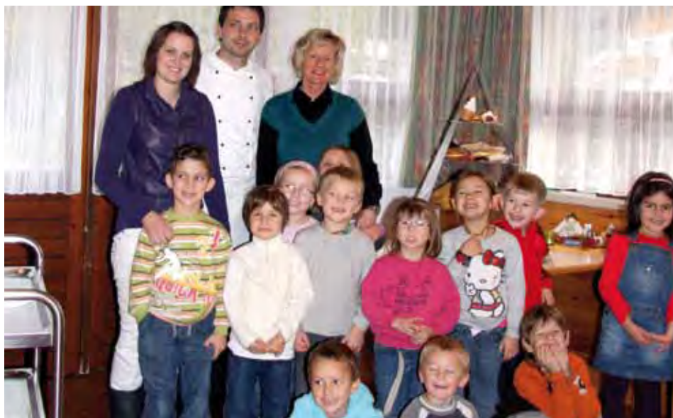
Ernährungsseminar für unsere Kleinen

Einen „gesunden Nachmittag“ verbrachten die Kinder des Nachmittagkindergartens im Alten- und Pflegeheim Kundl.