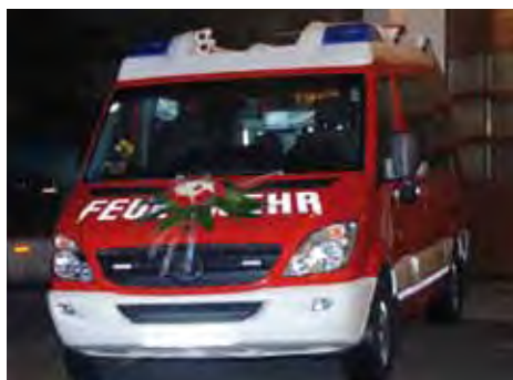
Das neue Kommandofahrzeug

Am Samstag, den 17. Oktober hatten die Männer und Frauen der FF-Kundl viel zu tun. Bereits zur Mittagszeitieß es Brand im Dachbereich der Kirche.