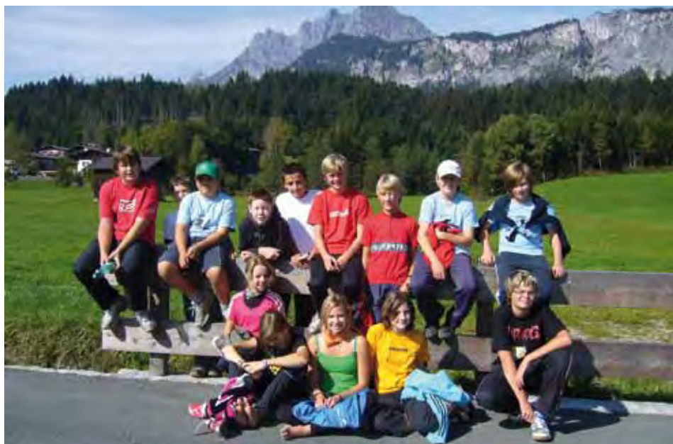
Das Laufteam der Hauptschule Kundl vor der Kulisse des Wilden Kaisers

14 Schüler der Hauptschule Kundl nahmen am 5. Oktober an der Orientierungslauf-Landesmeisterschaft für Schulen im herbstlichen St. Johann i.T. teil.