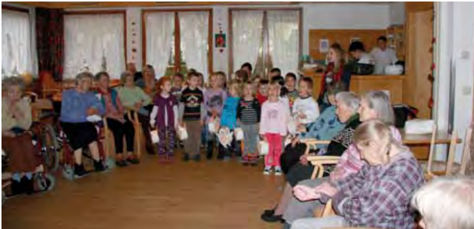
Martinilichter erhellen das Alten- und Pflegeheim

Der Besuch des Kundler Kindergartens anlässlich des Festes zum „hl. Martin“ ist bereits seit vielen Jahren ein fixer Bestandteil, der auch in diesem Jahr, im Zuge des Projektes „Jung und Alt“, natürlich wahrgenommen wurde.