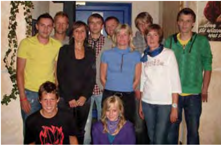
Die Aushängeschilder des TC Kundl

Mitte August wurden bei wunderbarem Wetter die heurigen Clubmeisterschaften durchgeführt.