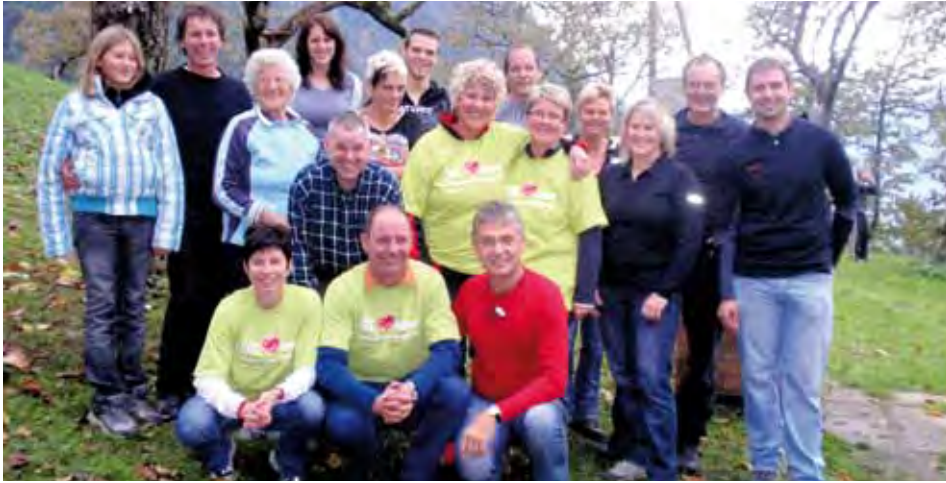
Das bewährte Organisationsteam des FC Bergwies

Trotz der schlechten Witterung meldeten sich über 150 TeilnehmerInnen zum Fitmarsch am 26. Oktober auf der schon traditionellen Route vom Schießstand über die Brach zur Bergwies an. Der Großteil der Teilnehmer