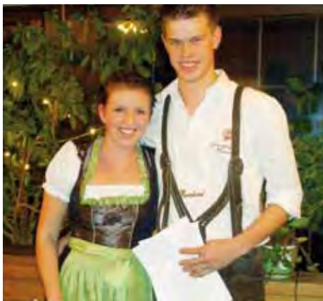
Ein fesches Funktionärspaar