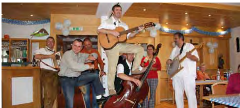
„Di 3 Gfierigen“

Fröhliche und ausgelassene Stimmung herrschte beim diesjährigen Oktoberfest im Alten- und Pflegeheim Kundl.