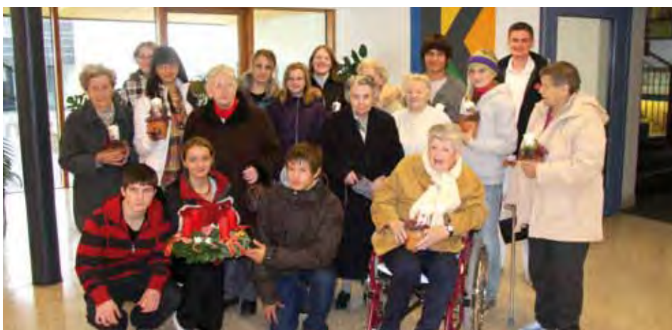
Nach dem Adventkranzbinden