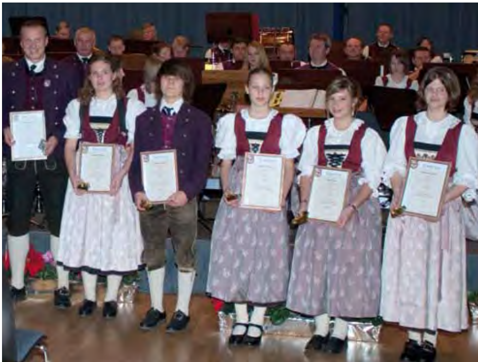
Die erfolgreichen Jungmusikanten mit ihren Leistungsabzeichen

Das alljährliche Abschlusskonzert der Bundesmusikkapelle ging am 14. November unter dem Motto „Faszination der Berge“ über die Bühne.