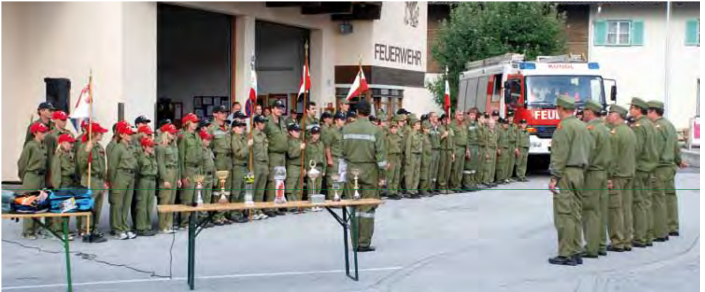
Antreten der Gruppen vor dem Kundler Feuerwehrhaus

Am 12. September 2009 fand in Kundl der alljährliche Kompassmarsch der Feuerwehrjugend des Bezirkes Kufstein statt.