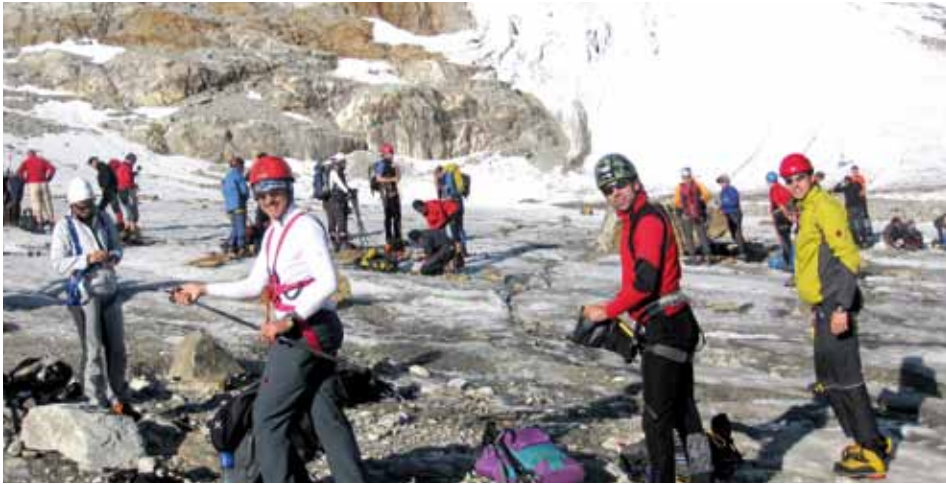
Die „Gipfelstürmer“ bei hervorragendem Wetter

Am 4. Juli fand nach größeren Vorbereitungsarbeiten das 1. Familiengrillen der Ortsgruppe Kundl-Breitenbach statt.