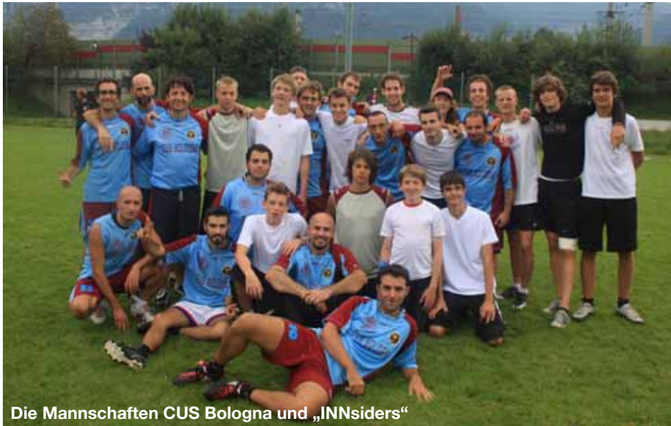
Die Mannschaften CUS Bologna und „INNSiders“

Am 12./13. September 2009 fand auf den Kundler Trainingsplätzen bereits das 6. Internationale Ultimate Frisbee-