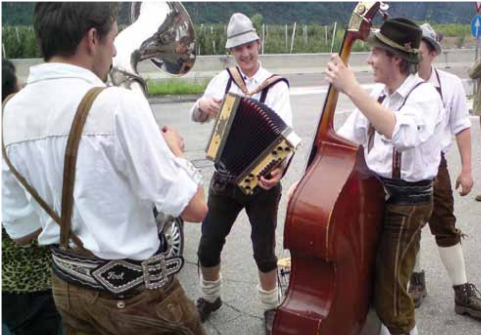
Die „Surfassl Buam“ sorgen für beste Stimmung

Am 13. Juni veranstaltete die JB/LJ Kundl ein riesengroßes Fest auf dem Parkplatz der Sandoz.