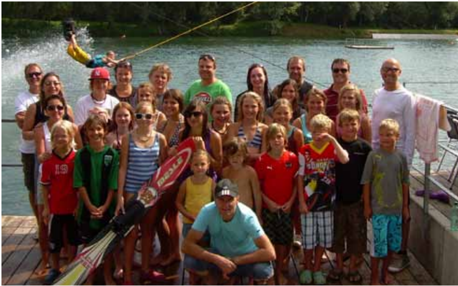
Der WSV-Kundl-Nachwuchs mit Betreuern und Eltern

Am 26. August kam es zum ersten „nassen“ Training des WSV. Die Nachwuchsalpinsportler schnupperten das erste Mal Kontakt mit den „Brettln“ auf dem Wasser. Am Hödenauersee in Kiefersfelden boten sich den Kundler Kindern bei sommerlichen Außentemperaturen beste Bedingungen. Nach anfänglichen Startschwierigkeiten und zahlreichen Tauch- und Schwimmeinlagen bewährten sich die SportlerInnen in dem neuen Element. Die Begeisterung der kleinen und großen WSVler war kaum zu bremsen. Ein spannender Aktivvormittag wurde mit tollen Erinnerungen belohnt. Ein Dank an den EHC-Kundl, der den Vereinsbus zur Verfügung stellte.