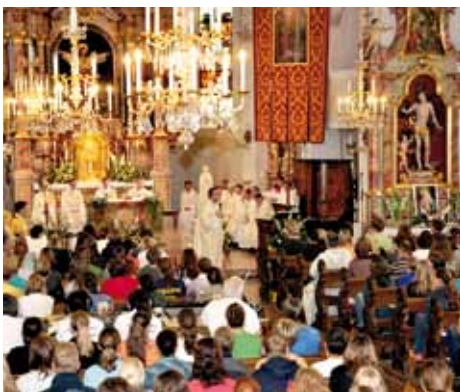
Die hl. Messe ein Höhepunkte

Zur großen Freude aller Beteiligten konnte das „Liebe siegt“ - Jugendtreffen heuer wieder in Kundl stattfinden.