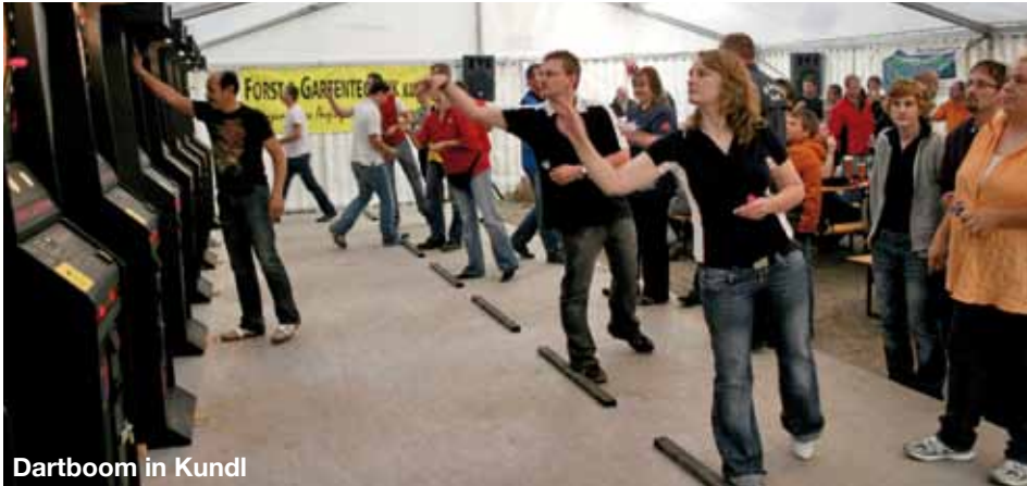
Dartboom in Kundl

Zum Start der Ligasaison 2009/2010 veranstaltete der DC Unicorn ein Turnier am Parkplatz des Gasthofs Neuwirt.