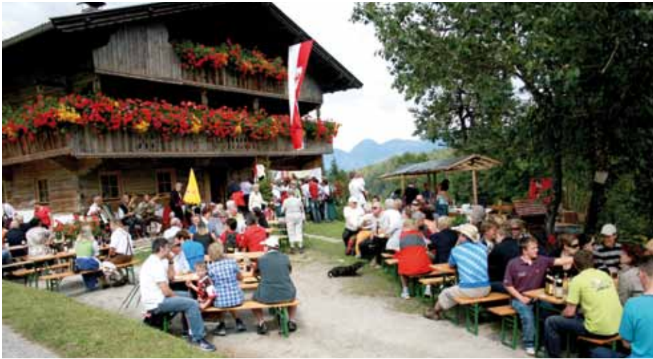
Wunderschöne Saulueger Bauernhöfe luden zur Einkehr ein

Und Kundl kann es doch. Es heißt ja oft, dass in Kundl keine wirklich guten Veranstaltungen stattfinden, Veranstaltungen und Feste oft nur schlecht besucht werden.