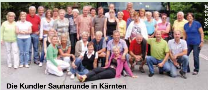
Die Kundler Saunarunde in Kärnten