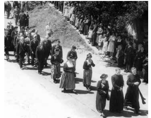
Die Festgesellschaft am östlichen Aufgang zur Kirche

Das Bildmaterial wurde von Fr. Anna Gschwentner (Jaggl Anna) zur