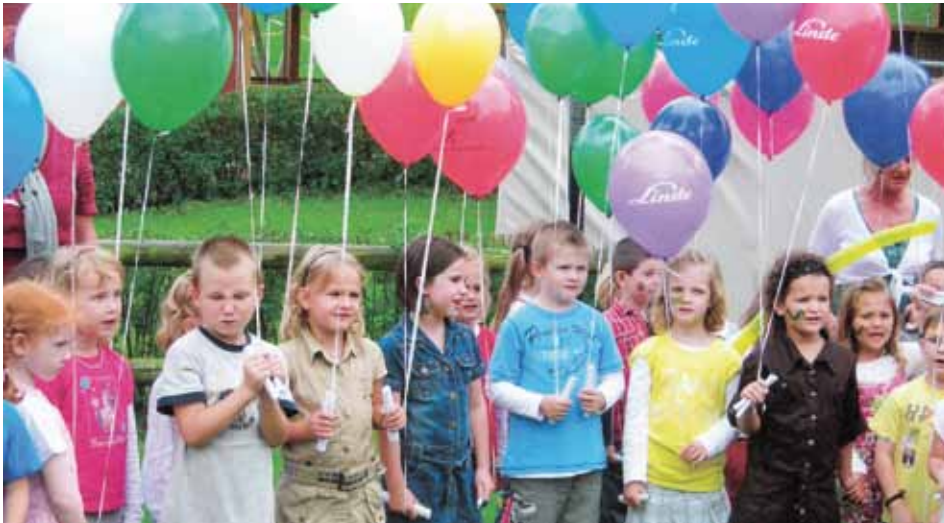
Vor dem Luftballonsteigen

Kurz vor Ferienbeginn feierten wir im Kindergarten noch ein großes Fest.