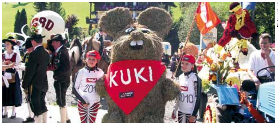
Das WM-Maskottchen KUKI

Für weitere Informationen besuchen Sie bitte unsere WM-Homepage: http://www.skibob-kundl.at