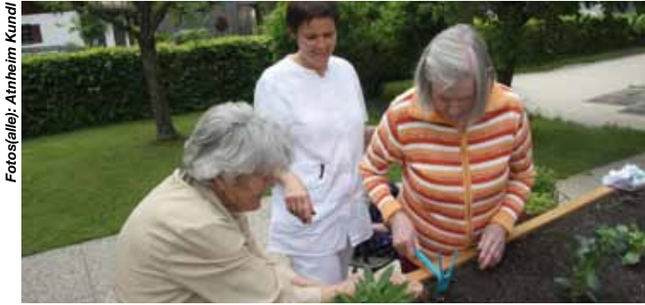
Fotosallej: Atrheim Kundl