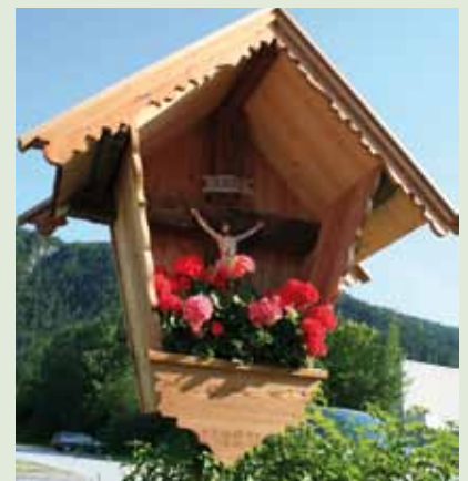
Das restaurierte Wegkreuz