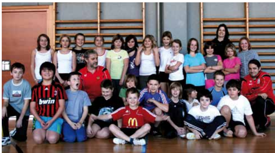
Sportstunde mit den ersten Klassen der Hauptschule

Die Begeisterung von Schülerinnen und Schülern für die klassische Leichtathletik hält sich in Grenzen. Verständlich, wenn immer nur die gleichen Übungen und Bewegungsformen absolviert werden. Laufen,