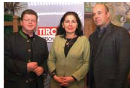
Die drei Obleute