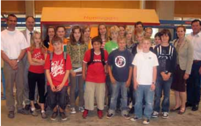
Die 3A-Klasse der Hauptschule Kundl beim Betriebsbesuch der Fa. Holzbau Höck am 3. Juni 2008

Der heutige Berufsorientierungsunterricht an der Hauptschule Kundl stand ganz im Zeichen des Projektes „Berufsorientierung aktiv“ – eine Zusammenarbeit zwischen heimischen Wirtschaftsbetrieben und der Schule.