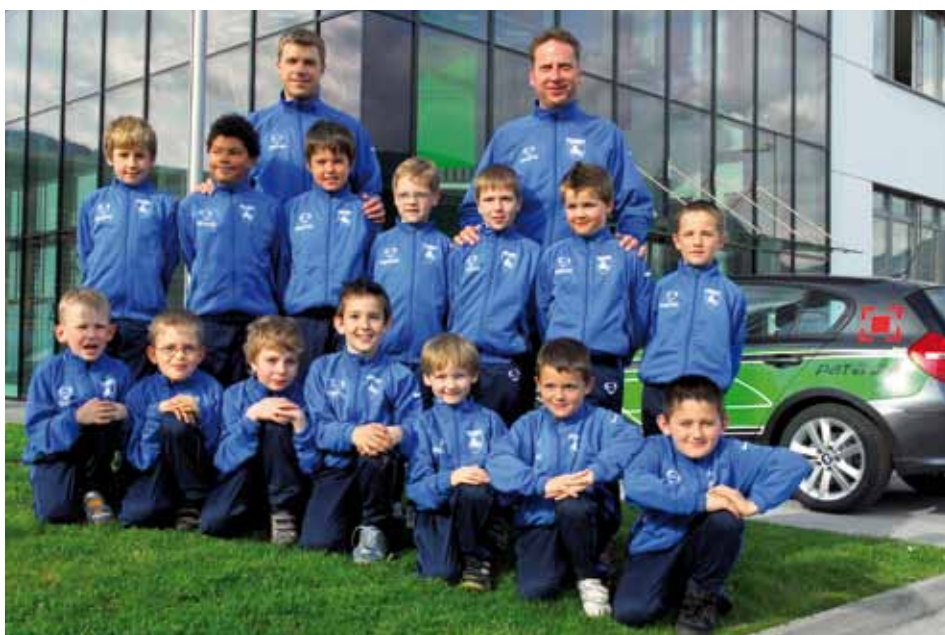
Die erfolgreiche Mannschaft U8 mit Betreuern im neuen Outfit.

Unsere U-7 hat sich nach verhaltenem Start gesteigert und sich noch ins Spitzenfeld der Tabelle hochgearbeitet. Und voll auf der Erfolgswelle befindet sich der Fußballkindergarten. Die von Wolfgang Rinnergschwentner und Manuel Seebacher betreuten Buben und Mädchen besiegten in ihrem ersten Spiel die Wildschönau mit 16:2 und bei ihrem zweiten Auftritt den SV Breitenbach mit 8:5.