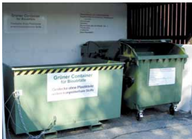
Die zentrale Sammelstelle

Diese zwei zusätzlichen Behälter sollen bitte nicht dazu verwendet werden, ganze Blumenreste samt Erde zu entsorgen, sondern dienen nur für kleinere Abfallmengen. Wenn Sie größere Grabarbeiten durchführen, bitten wir Sie die Abfälle bei der zentralen Sammelstelle zu entsorgen. Hauptsächlich wurden die neuen Behälter für ältere Personen aufgestellt, um diesen den weiten Weg zur zentralen Sammelstation zu ersparen.