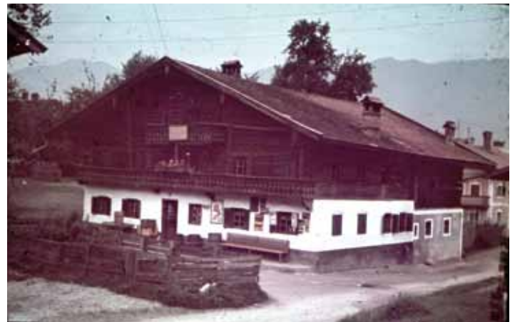
Altes „Klement“ Haus (in früherer Zeit Lebensmittelgeschäft)