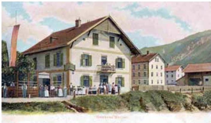
Gasthaus Wallner (frühe Farbaufnahme), später „Reschti“ der Familie Gerl (vor einigen Jahren abgebrochen). Gastgarten mit Gästen.