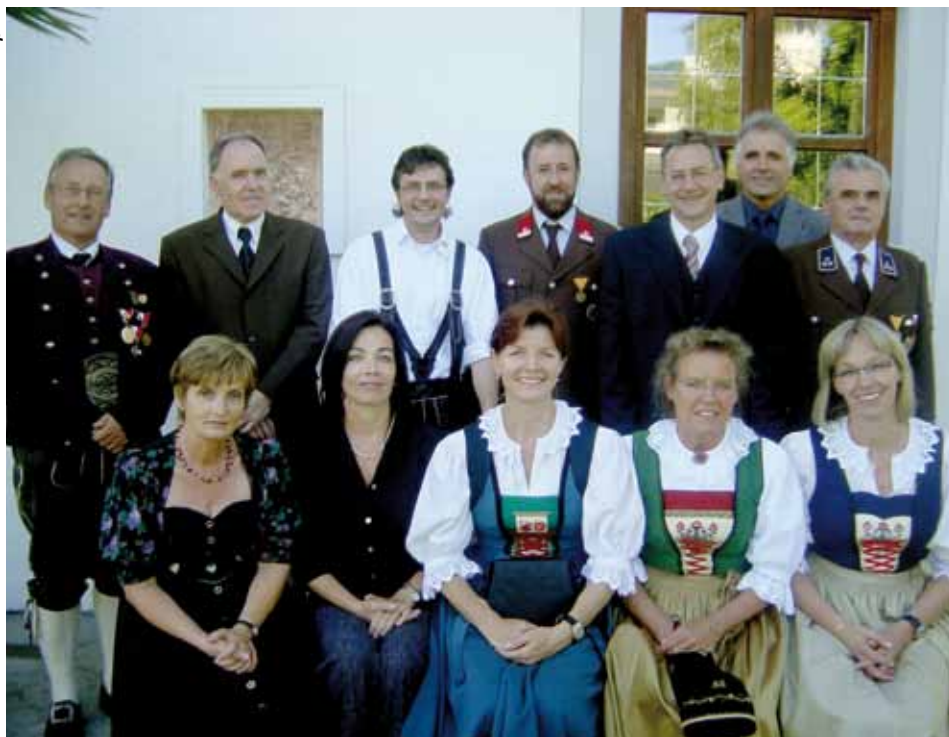
Der neugewählte Pfarrgemeinderat aus Kundl.

Am 18. März 2007 wurde der Pfarrgemeinderat für die nächsten 5 Jahre gewählt. 4 Frauen und 6 Männer bilden den neuen Pfarrgemeinderat, ein Mitglied wurde neu hinein gewählt.