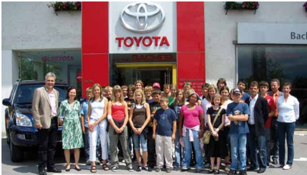
Die beiden dritten Klassen bei der Betriebsbesichtigung im Autohaus Toyota Bacher in Hall in Tirol