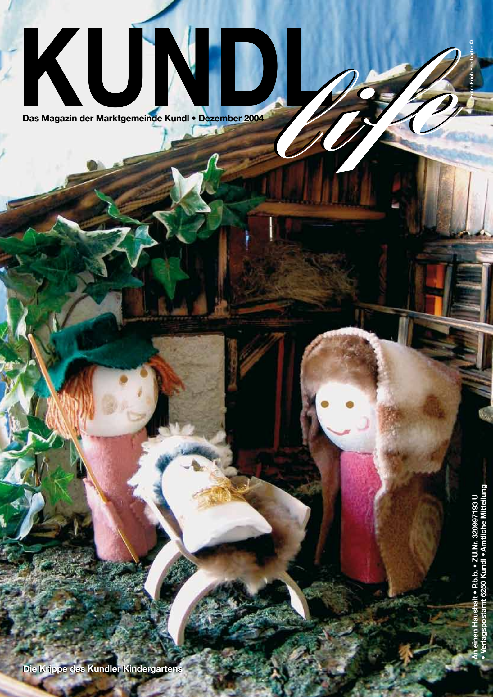
Die Krippe des Kundler Kindergartens

An einen Haushalt • P.b.b. • Z.U.Nr. 320997/193 U • Verlagspostamt 6250 Kundl • Amtliche Mitteilung